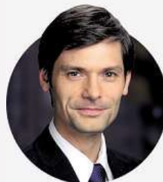
2. Marek Hilšer