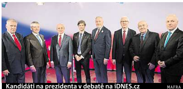
Kandidáti na prezidenta v debatě na iDNES.cz

„Pracuji jako osobní lékař pana prezidenta po celé období. Provádíme pravidelné lékařské kontroly, jak odběry, tak další lékařská vyšetření. Po celé období docházelo ke kompenzaci zdravotního stavu pana prezidenta z hlediska cukrovky. Měnili jsme několikrát léčbu,“ řekl Kalaš. „Cukr jako takový se znormalizoval,“ uvedl prezidentův osobní lékař. IDNES.cz