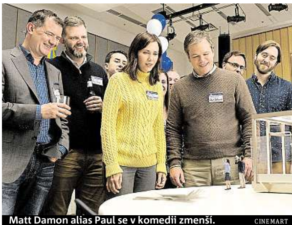
Matt Damon alias Paul se v komedii zmenší.

Představte si, že byste mohli pohádkově zbohatnout. Stačilo by splnit jednu malinkou podmínku. Dobrovolně absolvovat proces, na jehož konci byste měřili pouhých deset centimetrů. Šli byste do