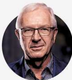
1. Jiří Drahoš