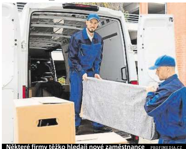
Některé firmy těžko hledají nové zaměstnance

I přes nárůst nezaměstnanosti zůstává situace na trhu práce příznivá, což je odrazem dobrého výkonu ekonomiky. Shodují se na tom oslovení analytici. Letos bude míra nezaměstnanosti podle ekonomů nadále nízká, prostor pro výraznější pokles je ale již omezený. Proto bude v souvislosti s pokračujícím dobrým vývojem ekono-