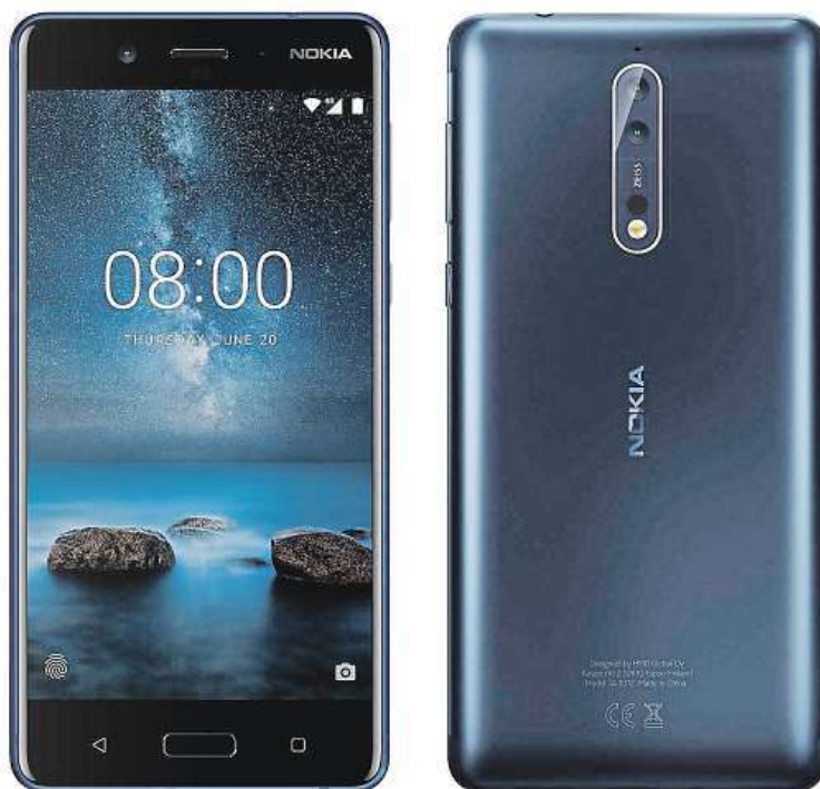
Legenda se vrací. Bude Nokia zase slavná značka?

SIM karty nebo trojice mikrofonů schopných zaznamenávat prostorový 360° zvuk. Nokia 8 se jednoznačně povedla a znovu dokázala, že oprášená značka nabrala po povstání z popela správný směr.