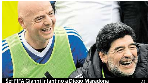
Šéf FIFA Gianni Infantino a Diego Maradona

Současný šéf FIFA Gianni Infantino se přiklání k rozšíření