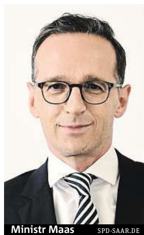
Ministr Maas

Německé bezpečnostní složky nyní registrují asi 550 radikálů, kteří by mohli spáchat útok. Jedním z takto označených extremistů byl již v minulosti také Tunisian Anis Amri, který v prosinci za-