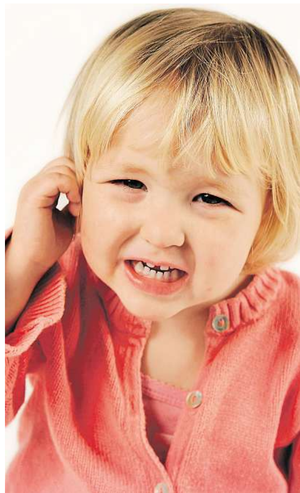
Je to velmi bolestivá záležitost.

V chladném počasí je třeba děti nejen dobře oblékat, ale také preventivně otužovat. V dětském jídelníčku nesmí chybět strava bohatá na vitamíny. Prevencí je také očkování proti pneumokokům. KAMILA HUDEČKOVÁ