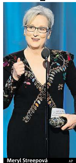
Meryl Streepová

Na výroky Streepové reagovalo mnoho jejích kolegů. Režisér Michael Moore napsal, že to byla „dojemná chvíle, jaké se v televizi vidí zřídka“. Herečka Juliette Lewisová napsala: „Meryl Streepová říká všechno, co je potřeba, důrazně a elegantně.“