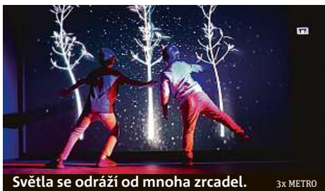
Světla se odráží od mnoha zrcadel.