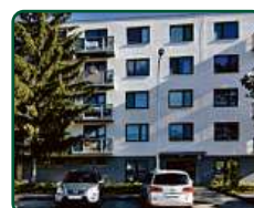
Rezidence Pěkná, Brno, nebytové prostory