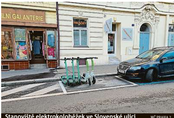
Stanoviště elektrokoloběžek ve Slovenské ulici

„Je to sice teprve začátek, ale situace se u nás na dvojce začíná pomalu zlepšovat. Stížností na poházené koloběžky je výrazně méně a už se nestává, že by o ně lidé zakopávali na každém rohu. Jsem přesvědčena, že je to výsledek důsledného a nekompromisního postoje radnice při jednáních s bikesharingovými společnostmi. Je evidentní, že tento druh sdílené dopravy potřebuje systémové řešení a nastavení pravidel,“ hodnotí současnou situaci v ulicích Prahy 2 její starostka Alexandra Udženija.