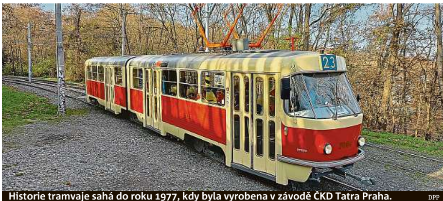
Historie tramvaje sahá do roku 1977, kdy byla vyrobena v závodě ČKD Tatra Praha.