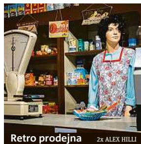
Retro prodejna 2x ALEX HILLI

Byť byl všeho nedostatek, vánoční kolekce musela být v 70. a 80. letech k dostání. Tuto ryze československou specialitu si v muzeu můžete připomenout také. Kolekce