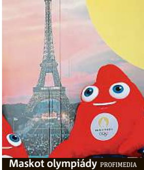
Maskot olympiády

Francie začala s výstavbou sportovišť před dvěma lety, letos jsou už stavební práce výrazně rozsáhlejší. „Stavíme v deseti lokalitách, kde pracuje 40 stavbyvedoucích a více než 8 tisíc dělníků,“ uvedl pro deník Le Monde Gaëtan Rudant, který dohlíží na inspekci práce. Jeho úřad letos provedl na 500 kontrol a zhruba 100 dělníků vykázal