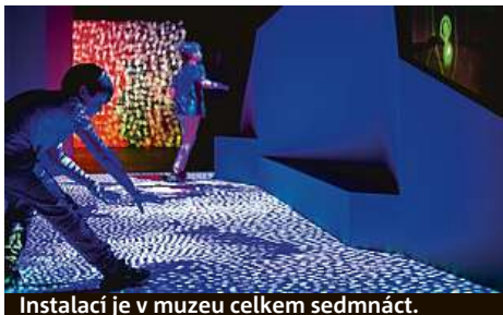
Instalací je v muzeu celkem sedmáct.

Návštěva výstavy zabere zhruba hodinu času, vstupenky za 280 Kč (dítě 170 Kč) lze koupit na místě. HOP