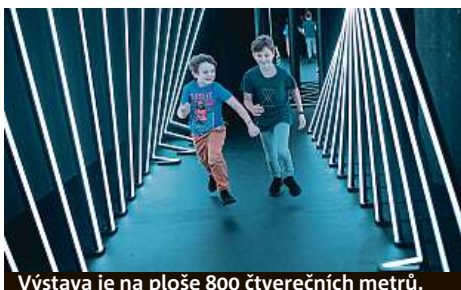
Výstava je na ploše 800 čtverečních metrů.