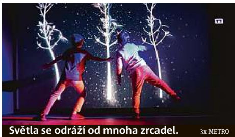
Světla se odráží od mnoha zrcadel.