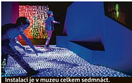
Instalací je v muzeu celkem sedmáct.

Návštěva výstavy zabere zhruba hodinu času, vstupenky za 280 Kč (dítě 170 Kč) lze koupit na místě. HOP