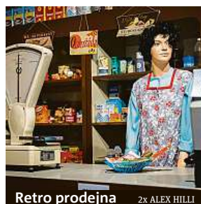
Retro prodejna 2x ALEX HILLI

Byť byl všeho nedostatek, vánoční kolekce musela být v 70. a 80. letech k dostání. Tuto ryze československou specialitu si v muzeu můžete připomenout také. Kolekce