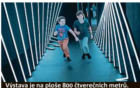
Výstava je na ploše 800 čtverečních metrů.