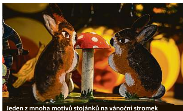
Jeden z mnoha motivů stojánek na vánoční stromek