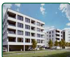
Bytové domy Břeclav, ul. Charvátská