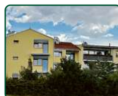
Bytový dům, Brno, ul. Holzova