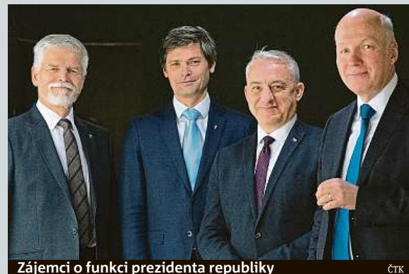
Zájemci o funkci prezidenta republiky