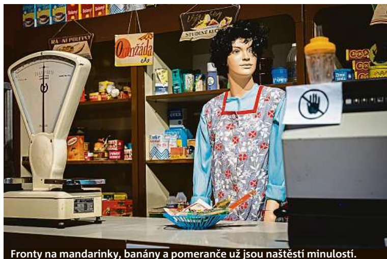
Fronty na mandarinky, banány a pomeranče už jsou našťastí minulostí.