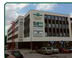
eFi Obchodní Galerie, byty a kanceláře - Jihlava