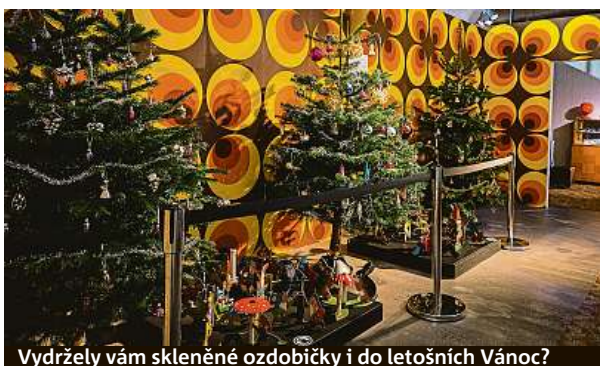
Vydržely vám skleněné ozdobičky i do letošních Vánoc?

• Prodej bytu 17,36 m2 k bydlení a rekreaci v rezidenci Sázkavský ostrov. 30 minut od Prahy. na břehu řeky Sázavy. Cena 1450000 Kč. muzar888@gmail.com