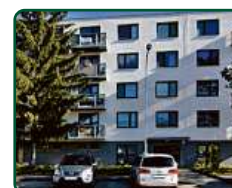
Rezidence Pěkná, Brno, nebytové prostory