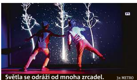
Světla se odráží od mnoha zrcadel.