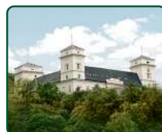
Zámek Račice, Račice-Pístovice - hl. budova