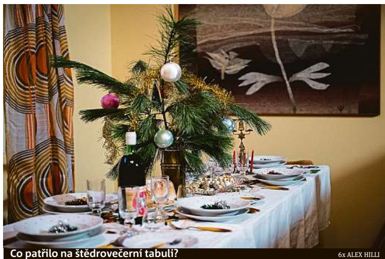
Co patřilo na štedrovečerní tabuli?