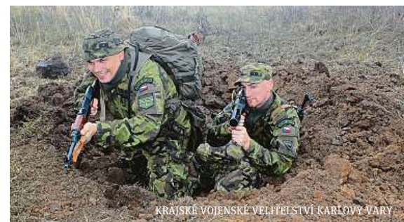
KRAJSKÉ VOJENSKÉ VELITELSTVÍ KARLOVY VARY

• Když začala inflace růst, Nekula začal mluvit o kontrolách marží obchodních řetězců. „Účelově jsem použil příklad s točeným salámem, kde byla přírůžka 246 procent,“ řekl. Cílem bylo podle něj vzbudit pozornost obchodníků, nárůst cen tak byl pozvolnější. ČTK