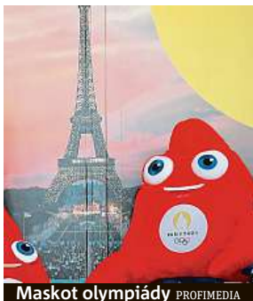
Maskot olympiády

Francie začala s výstavbou sportovišť před dvěma lety, letos jsou už stavební práce výrazně rozsáhlejší. „Stavíme v deseti lokalitách, kde pracuje 40 stavbyvedoucích a více než 8 tisíc dělníků,“ uvedl pro deník Le Monde Gaëtan Rudant, který dohlíží na inspekci práce. Jeho úřad letos provedl na 500 kontrol a zhruba 100 dělníků vykázal