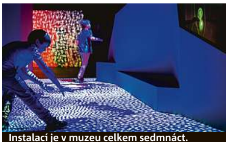
Instalací je v muzeu celkem sedmáct.

Návštěva výstavy zabere zhruba hodinu času, vstupenky za 280 Kč (dítě 170 Kč) lze koupit na místě. HOP