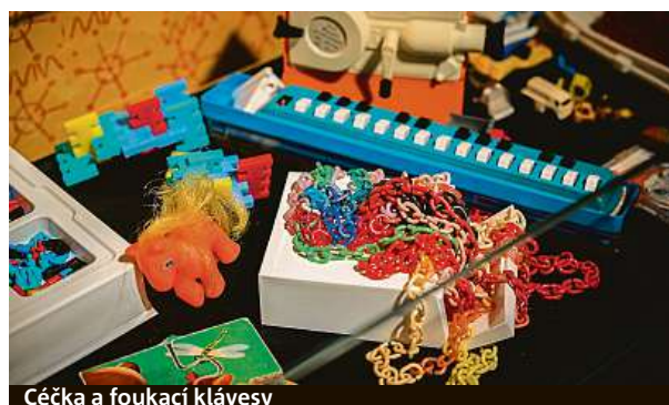
Čečka a foukací klávesy

Byť byl všeho nedostatek, vánoční kolekce musela být v 70. a 80. letech k dostání. Tuto ryze československou specialitu si v muzeu můžete připomenout také. Kolekce vyráběly firmy jako Orion Praha, Maryša Rohatec či Zora Olomouc a bývaly v ob-