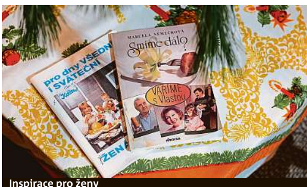
Inspirace pro ženy

Možná vás překvapí, co se od 70. a 80. let změnilo, a kolik naopak zůstalo stejné. S interaktivní expozicí se vrátíte zpátky v čase před rok 1989. Na výstavě se podílel také projekt Svoboda není