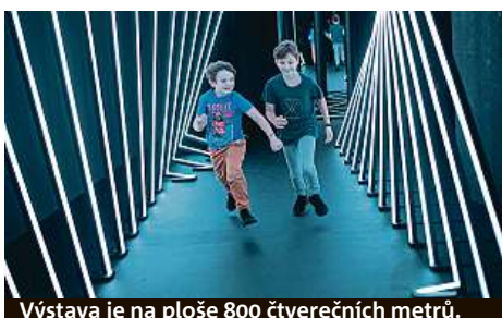
Výstava je na ploše 800 čtverečních metrů.