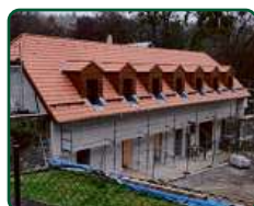
Zámek Račice, Račice-Pístovice - podzámčí