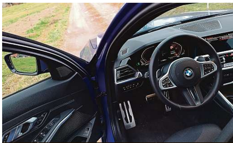
Kvalita a zase kvalita. Interiéru není co vytknout. Působí svěže.