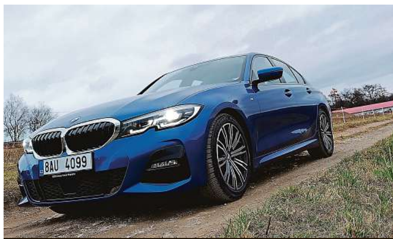
Vypadá už téměř jako BMW řady 5. Ale ne, je to trojka. Jen trochu narostla.

V tomto testu se příliš kritiky nedočtete. Není ji kde brát. Takto má vypadat sedan pro každý den. PETR HOLEČEK