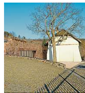
Vizuál viničního domku