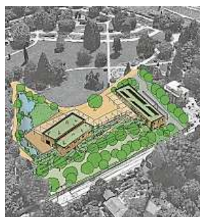
Nové centrum z nadhledu