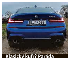
Klasický kufr? Paráda

Mezigeneračně je auto ve všech ohledech tužší – pevnější je karoserie i některé prvky podvozku, který navíc dostal tlumiče s hydraulickými dorazy. Takže auto pěkně žehlí silnice bez otřesů, přitom drží v zatáčkách – to jsou tedy vedle dynamického a šetrného motoru další misky v rovnováze. Tuhý podvozek je DNA sportovních sedanů, ale zároveň je jízda pohodlná a řízení poddajné.