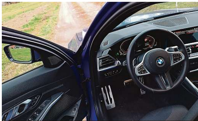
Kvalita a zase kvalita. Interiéru není co vytknout. Působí svěže.