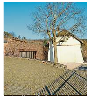
Vizuál viničního domku