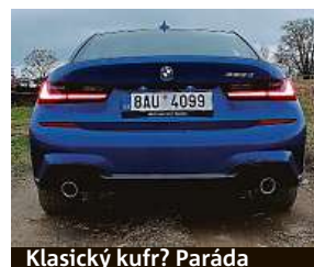
Klasický kufr? Paráda

Mezigeneračně je auto ve všech ohledech tužší – pevnější je karoserie i některé prvky podvozku, který navíc dostal tlumiče s hydraulickými dorazy. Takže auto pěkně žehlí silnice bez otřesů, přitom drží v zatáčkách – to jsou tedy vedle dynamického a šetrného motoru další misky vah v rovnováze. Tuhý podvozek je DNA sportovních sedanů, ale zároveň je jízda pohodlná a řízení poddajné.