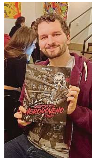
Knihy Rozšafného a jeho party pokrývá přes šest set filmů. MET

Mezi typické české horory, o kterých se v knize dočtete, patří například Golem