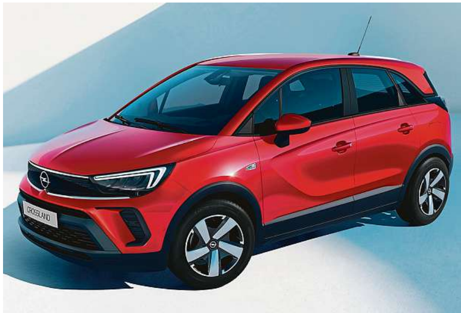
Opel Crossland překvapí zájemce nejen příjemnou spotřebou paliva na sto kilometrů, ale především cenou. Ve verzi HIT se vejde pod čtyři sta tisíc korun.

Běžného řidiče ale spíš potěší jemně sportovní chování na zatáčkovitých okreskách, které tužší odpružení Crosslandu HIT zvládá naprosto suverénně. A v revíru mimoměstských silnic se Crossland HIT odvděčí i vel-