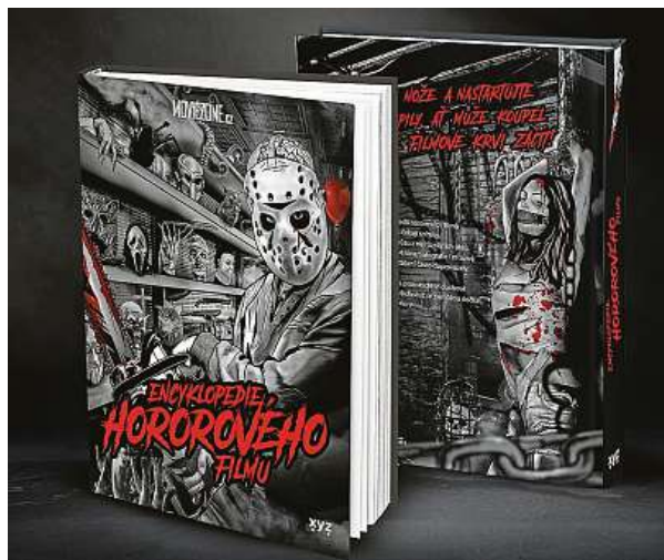
Moviezone vás zve do kina na Vymítače ďábla a křest Encyklopedie hororového filmu, a to v pondělí 20. listopadu ve 20.30. ALBATROS

Psychologický horor je pak v knize definován jako subžánr, jenž nespolehá na krvelačná monstra, ale na lidské nitro. „Zabývá se psychologií vrahů, fobiemi, halucinacemi, úzkostmi či temnými stránkami lidské mysli. Tyto horory chtějí diváka spíše znepokojit než jednorázově