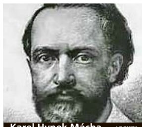
Karel Hynek Mácha

Ten obešel nejen české kraje, když putoval po romantických zříceninách, ale s kamarádem se vydal i na pouť do Itálie. Podle některých svědectví denně urazil i šedesát kilometrů. A to v běžné, tedy ještě ne specializované