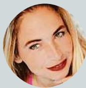
Ávina Stašina Bohnický hrbitov bláznů.