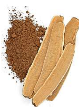
I v prášku

Na trhu je dnes pestrá škála doplňků stravy, které tuto houbu obsahují. Při koupi se zaměřte hlavně na to, kolik reishi ten který produkt obsahuje, jelikož extrakty nemají jasně definovaný obsah účinných látek. „V asijských zemích je výskyt civilizačních onemocnění daleko nižší než v Evropě, a to díky konzumaci zdravějších hub. Jejich průměrná roční spotřeba je v Číně 7,5 kg na osobu, v Evropě je to mnohonásobně méně. Houby je vhodné proto užívat pravidelně, zejména v doplňcích stravy ve formě kapslí, které obsahují celé plodnice se všemi účinnými látkami,“ doporučuje Ivan Jablonský, výzkumný pracovník v oblasti mykologie. KAMILA HUDEČKOVÁ