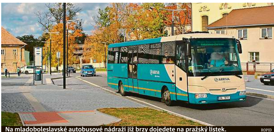
Na mladoboleslavské autobusové nádraží již brzy dojedete na pražský lístek.

Podle mluvčího organizátora dopravy Ropid Filipa Drápal tak budou autobusové spoje od metra Černý Most nově jezdit po dálnici na boleslavský autobusák v základním intervalu dvaceti minut.