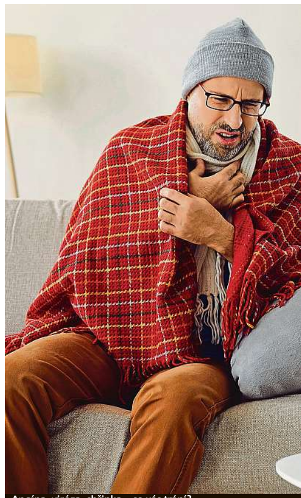
Angína, viróza, chřipka – co vás trápí?

Pokud si lékař není jistý, zda je původcem nemoci vir či bakterie a zda antibiotika jsou nebo nejsou potřeba, může udělat takzvaný CRP test přímo v ordinaci z kapky krve, která se odebere z prstu. Během pěti minut dostane výsledek. Pokud je hodnota C-reaktivního proteinu do 5 mg/l, jde o normální hladinu. Od 6 do 30 se jedná o mírnou infekci obvykle virového původu. Hodnota 50 až 200 mg/l ukazuje na bakteriální infekci, způsobenou zpravidla streptokoky či stafylokoky, tedy vyžadující léčbu antibiotiky. Pokud je ukazatel nad 200, pak jde o vážnou infekci. KAMILA HUDEČKOVÁ