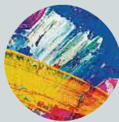
Milan Heran Oblast od Kotvy po Petrské náměstí.