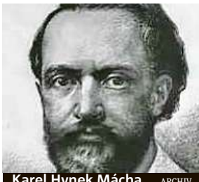
Karel Hynek Mácha

Ten obešel nejen české kraje, když putoval po romantických zříceninách, ale s kamarádem se vydal i na pouť do Itálie. Podle některých svědectví denně urazil i šedesát kilometrů. A to v běžné, tedy ještě ne specializované