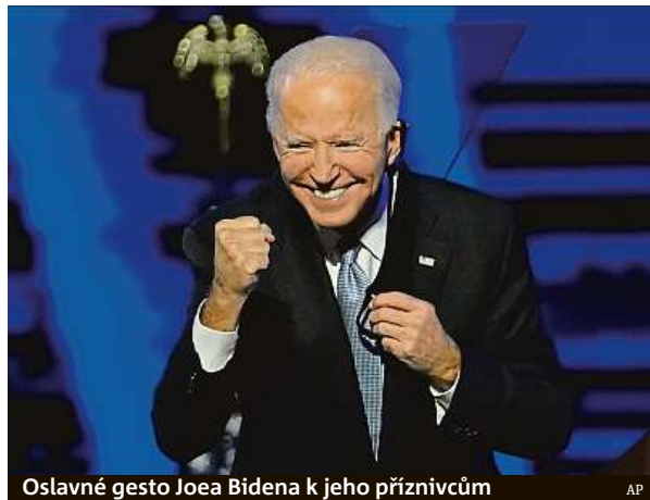
Oslavné gesto Joea Bidena k jeho příznivcům

Před Bidenem na pódiu krátce vystoupila jeho viceprezidentská kandidátka Kamala Harrisová, která bude první ženou v podobně vysoké funkci v historii USA. Ve volbách šlo podle ní o duši Spojených států,