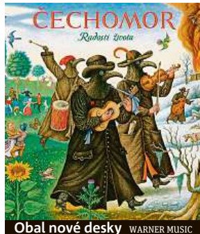
Obal nové desky WARNER MUSIC

Opět se v textech objevuje několik starodávných slov. Máte rádi nešední jazyk a krásu slov? Jedna píseň je i polsky, proč?