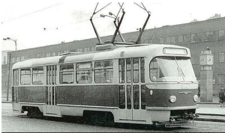
Dobová fotografie tramvaje T3 pochází ze sbírky Libora Hinčiči. ROPID

V listopadu 1960 převzal pražský dopravní podnik prototyp tramvaje T3. Dodnes ji milují také čtenáři Metra.