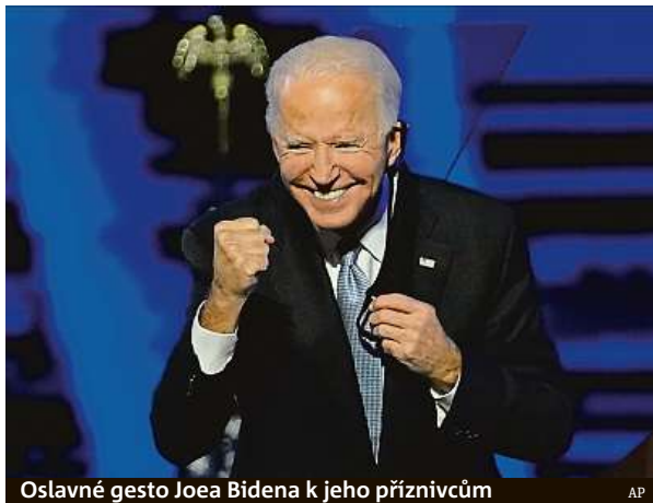
Oslavné gesto Joea Bidena k jeho příznivcům

Před Bidenem na pódiu krátce vystoupila jeho viceprezidentská kandidátka Kamala Harrisová, která bude první ženou v podobně vysoké funkci v historii USA. Ve volbách šlo podle ní o duši Spojených států,