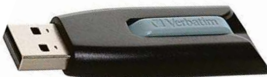
Verbatim Store'n'Go V3

Když navíc objednáte za více než 300 Kč, získáte dopravu zdarma až k vám