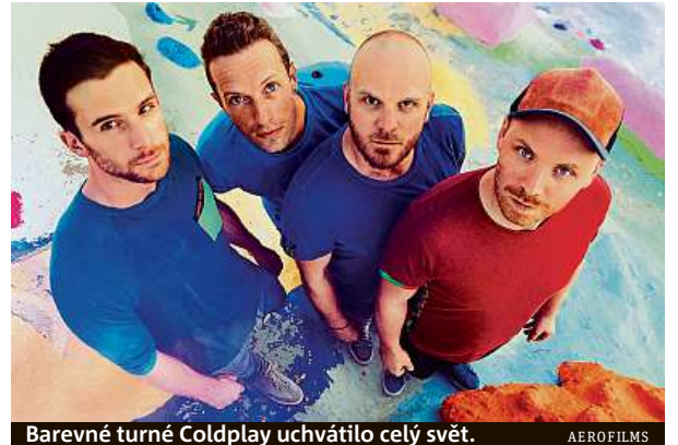
Barevné turné Coldplay uchvátilo celý svět.

Když už i fanoušek začne mít někde v půlce snímku, který trvá až neuvěřitelných 115 minut, pocit, že vše je až příliš barevné a sluníčkové, režisér umně začne rozklíčovat i komplikace. Ať už jsou to dávné neshody zpěváka Chrisa s bubeníkem Willem bě-