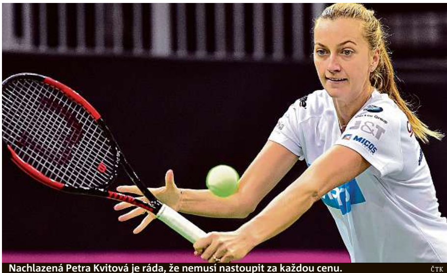
Nachlazená Petra Kvitová je ráda, že nemusí nastoupit za každou cenu.

Hrála jen zlehka a vyzkoušela pár úderů, returnů a servisů. „Doufám, že jsem tenis nezapomněla. Stačilo mi to, jsem ráda, že jsem si to zkusila, že jsem vylezla z postele a zacvičila si,“ uvedla Kvitová a dodala: „Bylo zbytečné hrát naplno a třeba se zranit. Je