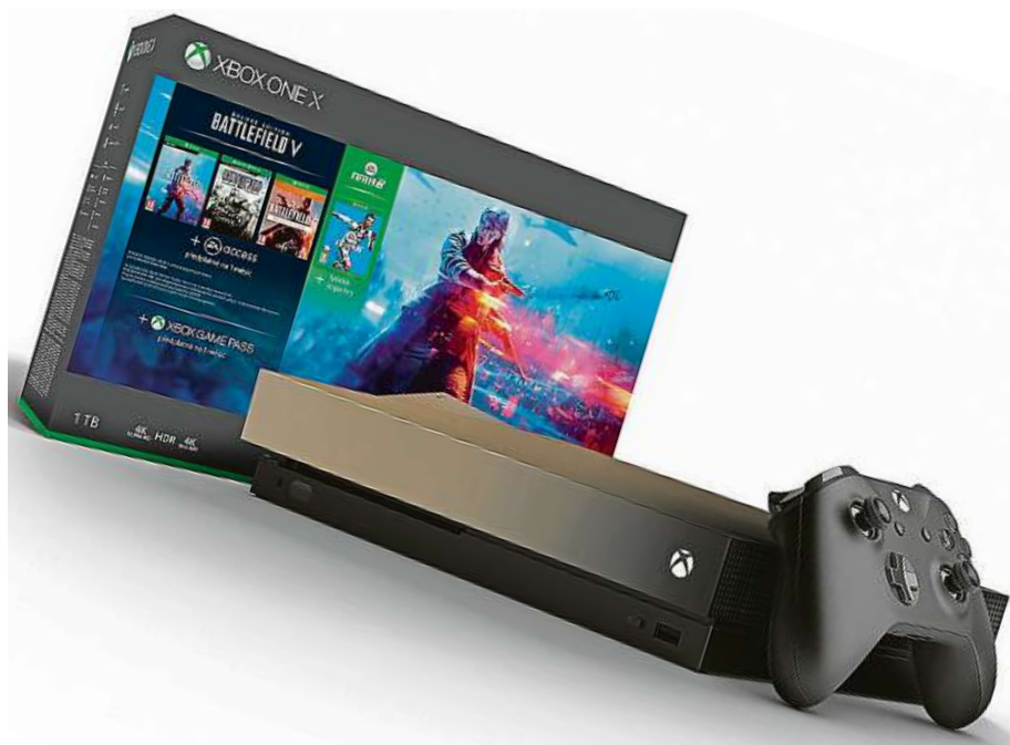
Xbox One X je v současnosti nejsilnější herní konzolí na světě.

V internetovém obchodě Mironet můžete nyní pořídít tuto konzoli v limitované edici Gold Rush Special Edition, a to rovnou v balíku s hrami FIFA 19 a Battlefield 5. Druhá jmenovaná akční střílečka sice oficiálně vychází až 20. listopadu, ale pokud si ji pořídíte v tomto balíčku s konzolí, můžete začít hrát už dnes. Balíček konzole Xbox One X spolu s uvedenými hrami v Mironetu pořídíte za 13 490 Kč.