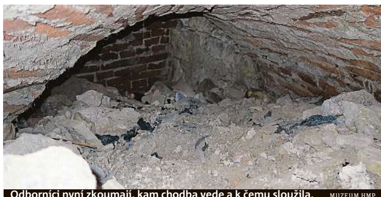
Odborníci nyní zkoumají, kam chodba vede a k čemu sloužila. MUZEUM HMP

Při rekonstrukci Svatomikulášské městské zvonice na Malostranském náměstí objevili dělníci barokní točité schodiště do podzemních prostor. Kam chodba vede a jakému účelu sloužila, by mohlo být známo v dalších týdnech. První o objevu informoval server iRozhlas.cz.