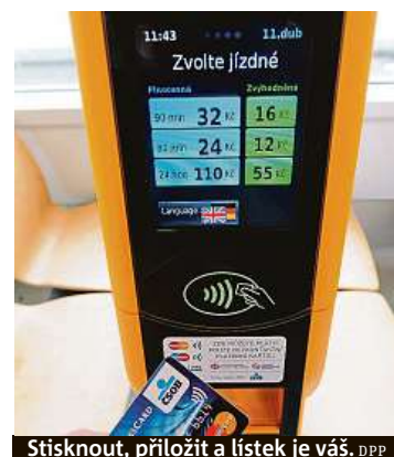
Stisknout, přiložit a lístek je váš. DPP

Dopravní podnik plánuje, že bezkontaktní platby budou možné u prostředních dveří. U tramvaji 14T budou zařízení na platby dvě, prostřední vstup totiž nemají. V současné době je možné platit bezkontaktně za lístek také například na autobusové lince číslo 119 a na lince AE.