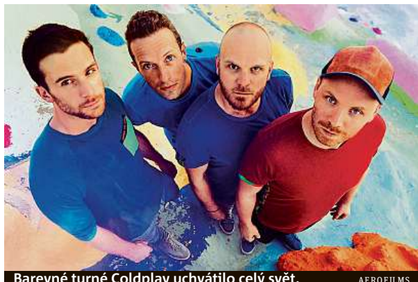
Barevné turné Coldplay uchvátilo celý svět.

Když už i fanoušek začne mít někde v půlce snímku, který trvá až neuvěřitelných 115 minut, pocit, že vše je až příliš barevné a sluníčkové, režisér umně začne rozklíčovat i komplikace. Ať už jsou to dávné neshody zpěváka Chrisa s bubeníkem Willem bě-