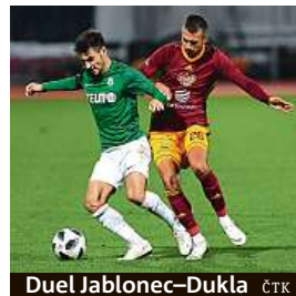
Duel Jablonec–Dukla ČTK

V minulém kole padlo 29 branek, což je průměr 3,6 gólu na zápas.