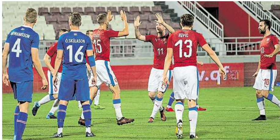
Radost českých fotbalistů z gólu