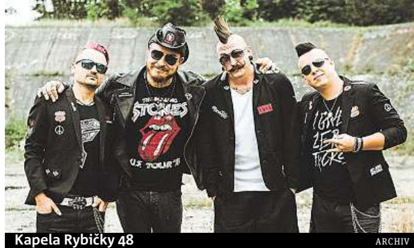
Kapela Rybičky 48