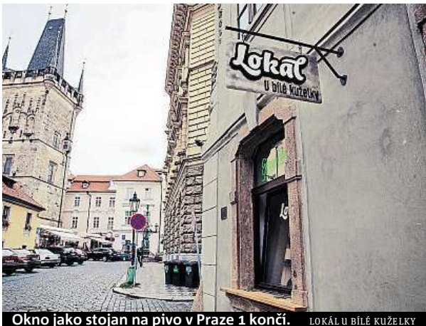
Okno jako stojan na pivo v Praze 1 končí. LOKÁL U BÍLÉ KUZELKY

„Toto další omezení má mít patrně za cíl likvidaci pohostinství jako takového. V létě máme vlastní zahrádku, takže až nyní v zimních měsících teprve přijde ta pra-