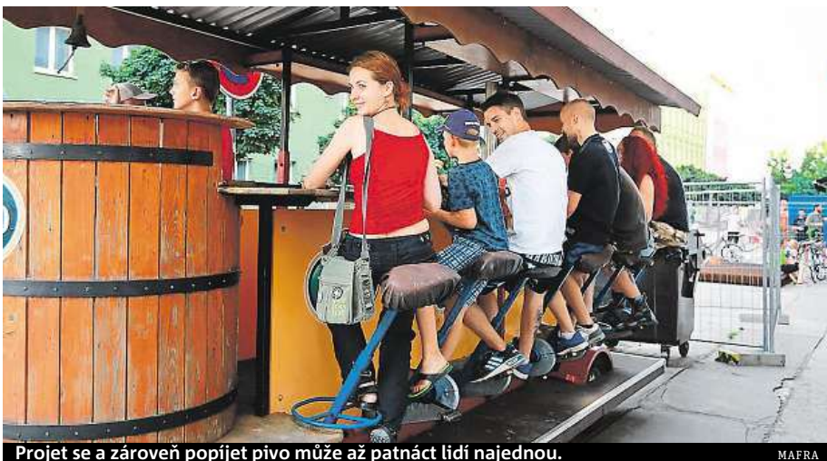
Projet se a zároveň popíjet pivo může až patnáct lidí najednou.

Stížností na tuto atrakci mají na radnici Prahy 1 desítky, podle Blažkové jde většinou o problém s hlukem i opilými turisty. „Dle zákona je také problém, že řidičem bývá pouze ten, který drží řídku, tedy ostatní, kteří byt pomáhají šlapáním v jízdě,