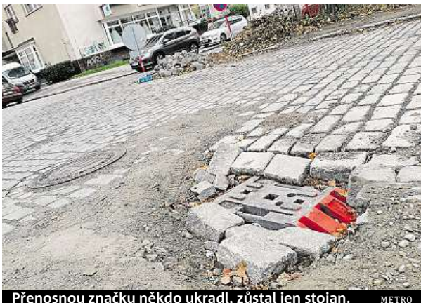
Přenosnou značku někdo ukradl, zůstal jen stojan.

Suchý beton později vystřídaly kostky, ale ani to pro-