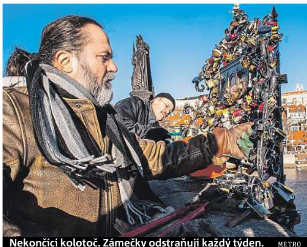
Nekonečný kolotoč. Zámečky odstraňují každý týden.