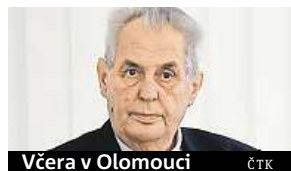
Včera v Olomouci

Vyšetřující lékař prezidenta Miloše Zemana označil zprávu o vážném zdravotním stavu prezidenta, kterou vypustil brněnský radní Svatopluk Bartík, za vymyšlenou a nepodloženou. Bartík v úterý napsal, že Zeman má rakovinu a že mu zbývá maximálně sedm měsíců života. Hradní mluvčí Jiří Ovčáček kvůli tomu na něj podá trestní oznámení. Prezident řekl, že mu „odešla cukrovka“ a jediné, co ho trápí, je polyfunkční neuropatie, tedy porušení nervů v nohou. Zeman je nyní na návštěvě Olomouckého kraje, kde také působil u navěným dojmem. ČTK