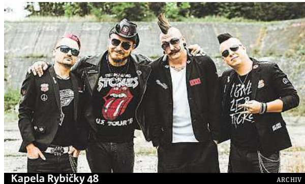
Kapela Rybičky 48