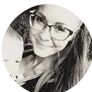
Alča Ká Klidně, beztak bych to brzy nabourala.