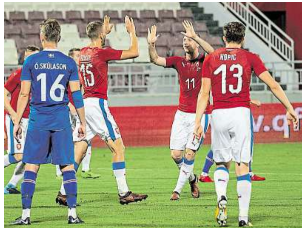
Radost českých fotbalistů z gólu

V sobotu od 17.30 nastoupí Češi ve druhém duelu na turnaji s domácím Katarom. PUR