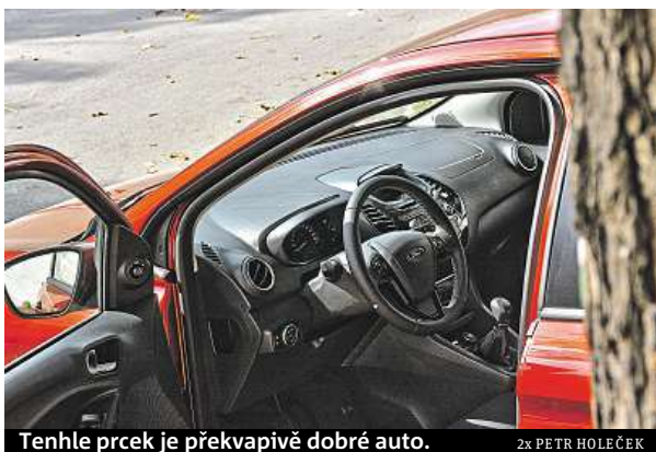
Tenhle preck je překvapivě dobré auto.