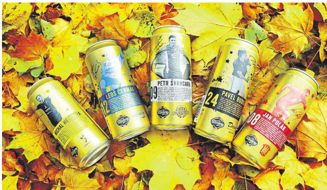
Limitovaná edice plechovek ze Starobrna už patří k podzimu.