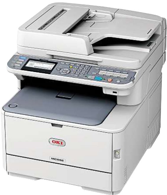
Multifunkční tiskárna OKI MC562dnw

LED svítidlo má široké spektrum využití, dosvití až 80 metrů a odolá i vodě.