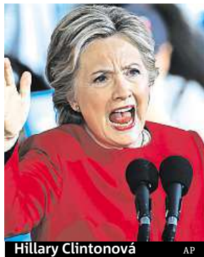
Hillary Clintonová

Dlouhé fronty včera i dnes na mnoha místech dokumentovaly velký zájem voličů o hlasování po jedné z nejvyhrocenějších kampaní americké historie prezidentských voleb. Podle televize CNN zvláště ve státech, kde síly demokratů a republikánů byly vyrovnané, voliči ochotně čekali před volebními místnostmi dlouhé desítky minut.