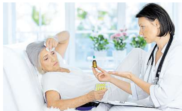
Denně bylo nemocných v průměru 21 600 lidí.

V Jihomoravském kraji se letos v prvním pololetí meziročně snížil počet nově hlášených případů dočasně pracovní neschopnosti o 1500 případů. Průměrná doba trvání nemocenské vzrostla o téměř tři dny, na 44 dní. Denně bylo ve stavu nemocných v průměru 21 600 lidí. Informace zveřejnila brněnská pobočka Českého statistického úřadu. V regionu bylo v prvním polo-