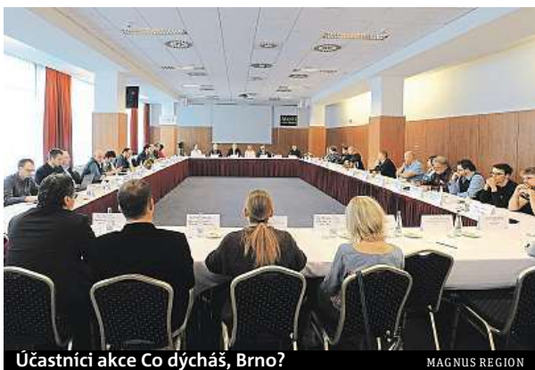
Účastníci akce Co dýcháš, Brno?

Akce se konala již potřetí a podle zúčastněných se Brno může třetí rok za sebou pochlubit zlepšeným ovzduším. „Je to hlavně díky meteorologickým podmínkám. „Za loňský rok byl v Brně pouze na jedné stanici překročen limit pro polévatý prach, a sice na Zvoňáče. Opravdu to byl vji-