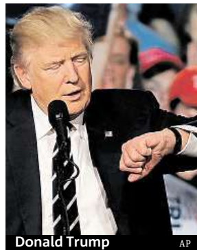
Donald Trump

Jedním z klíčových států byla Florida, kterou republikán Donald Trump musel získat, aby měl šanci volby celkově vyhrát. Podle televizi může účast v tomto státě překonat historický rekord. Již do pondělka tam možnosti hlasovat před rádným termínem využilo téměř 6,5 milionu voličů, což bylo nejvíce ze