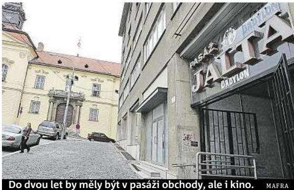
Do dvou let by měly být v pasáži obchody, ale i kino.

Brno získalo Jaltu na přelomu let 2005 a 2006 výměnou za jiné lukrativní pozemky a budovy. Původně ji mělo opravit a přestěhovat do ní některé své úředníky, kvůli špatnému stavu budovy se tak ale nestalo. Primátor Petr Vokřál při podpisu smlouvy