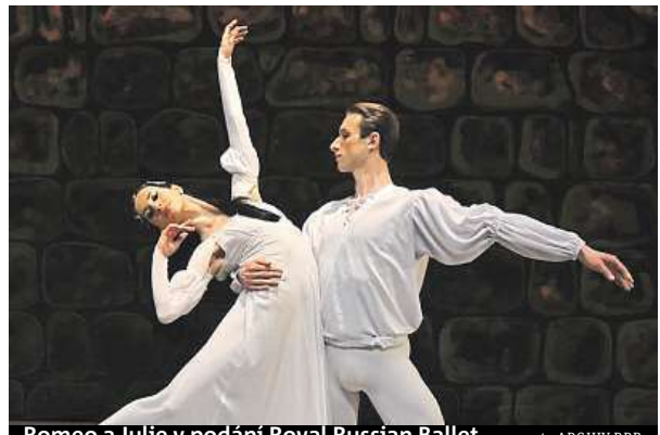
Romeo a Julie v podání Royal Russian Ballet