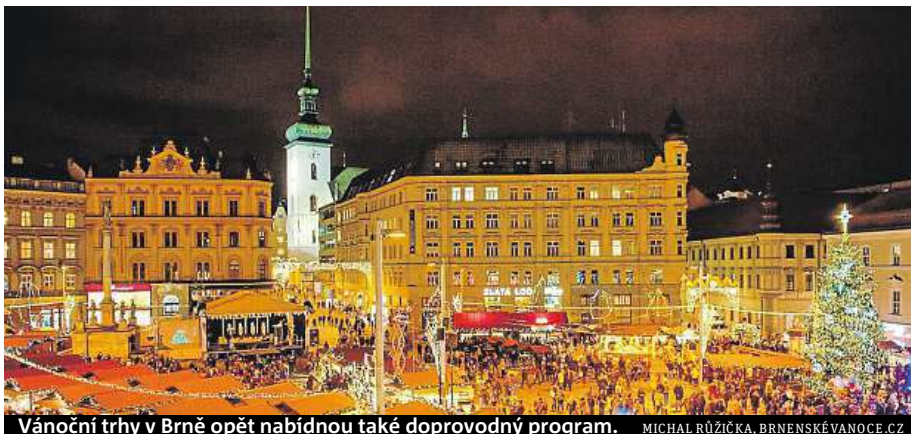
Vánoční trhy v Brně opět nabídnou také doprovodný program. MICHAL RŮŽIČKA, BRNĚNSKÉ VANOCE.CZ

Brněnské Vánoce, které začnou 25. listopadu v 17 hodin rozsvícením vánočního stromu na náměstí Svobody, připravuje Turistické informační centrum města Brna s partnery. Náměstí Svobody tradičně zaplní desítky stánků s nápoji, jídlem nebo různými výrobky.