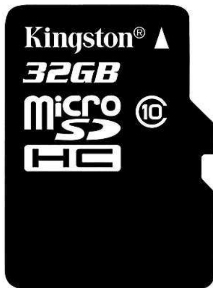
Kingston s doživotní zárukou a odolností vůči vodě

Chcete-li potom ověřenou kvalitu a spolehlivost, radíme přiklonit se k micro SDHC paměťovým kartám Kingston s doživotní zárukou, odolností vůči vodě, nárazům i extrémním teplotám.