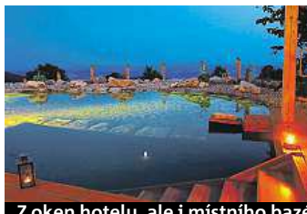
Z oken hotelu, ale i místního bazénku lze pozorovat krajinu. A jak to vypadá v pokoji?