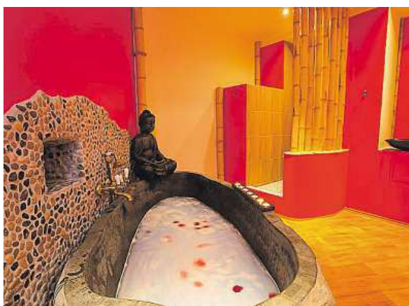
Pohodu si můžete užívat (vlevo), zaměstnanci hotelu se o vás postarají.