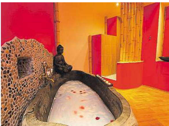
Pohodu si můžete užívat (vlevo), zaměstnanci hotelu se o vás postarají.