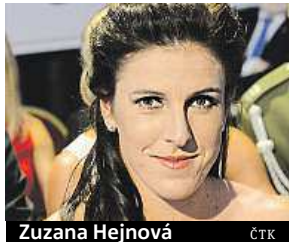
Zuzana Hejnová

Výsledky byly vyhlášeny v sobotu večer v pražském hotelu Ambassador – Zlatá husa