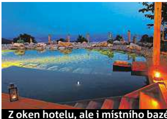
Z oken hotelu, ale i místního bazénku lze pozorovat krajinu. A jak to vypadá v pokoji?