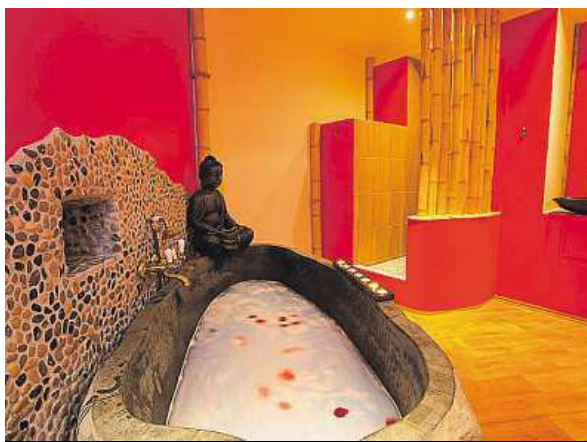
Pohodu si můžete užívat (vlevo), zaměstnanci hotelu se o vás postarají.