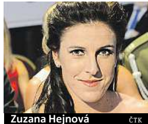
Zuzana Hejnová

Výsledky byly vyhlášeny v sobotu večer v pražském hotelu Ambassador – Zlatá husa