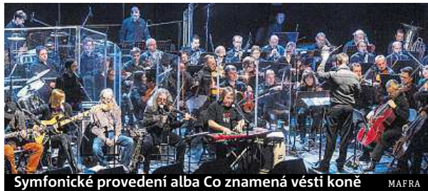
Symfonické provedení alba Co znamená vésti koně

S kapelou českého undergroundu i světovým jazzmannem Avišajem Cohenem vystoupí v listopadu Filharmonie Brno.