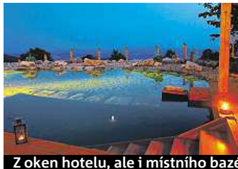
Z oken hotelu, ale i místního bazénku lze pozorovat krajinu. A jak to vypadá v pokoji?