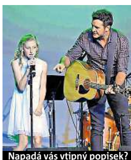
Napadá vás vtipný popísek?

Napište bublinu a reagujte na sloupek na: www.facebook.com/denikmetro