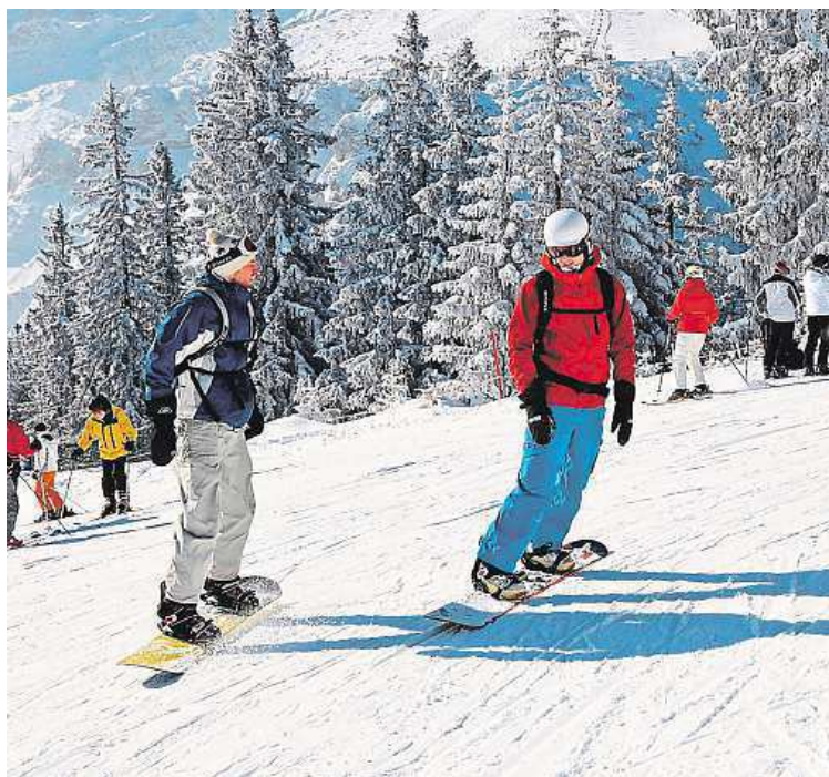
Vyrazte do Alp.