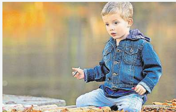
Nezvyklé teplo bylo včera také v Praze.

Na mnoha místech v Česku padaly teplotní rekordy. Rekord pro včerejší den překonalo 110 ze 137 stanic, které měří teplotu alespoň 30 let. Nejtepleji bylo v Kobylicích, a to 20,7 stupně. Čtyři absolutní listopadové rekordy padly také v sobotu. Meteorologové očekávají, že i začátek týdne bude teplý. V jeho závěru by se mělo ochladit, přesto bude skoro jarních 10 stupňů. ČTK