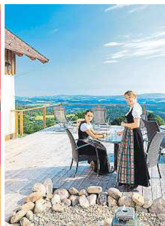
Pohodu si můžete užívat (vlevo), zaměstnanci hotelu se o vás postarají.