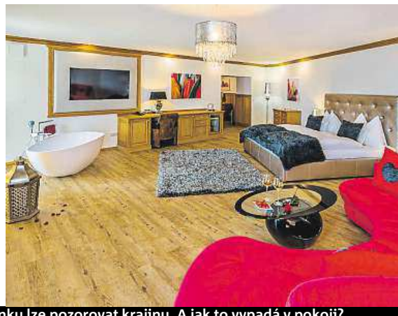
Z oken hotelu, ale i místního bazénku lze pozorovat krajinu. A jak to vypadá v pokoji?