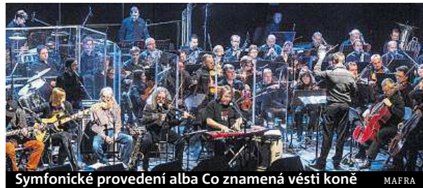
Symfonické provedení alba Co znamená vésti koně

S kapelou českého undergroundu i světovým jazzmannem Avišajem Cohenem vystoupí v listopadu Filharmonie Brno.