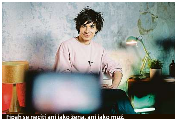
Fipah se necítí ani jako žena, ani jako muž.

Nahlédněte s deníkem Metro do zákulisí dokumentu Trans* . Jak žijí lidé, kteří se vymykají běžným škatulkám?