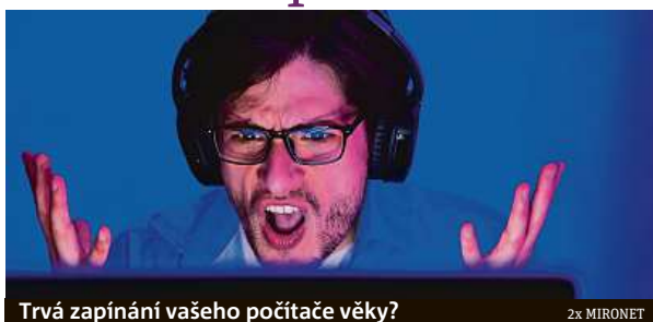
Trvá zapínání vašeho počítače věky?

A co v tomto případě znamená rychlý? Představme si to na konkrétním produktu,