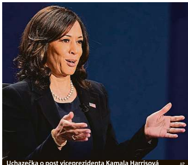
Uchazečka o post viceprezidenta Kamala Harrisová