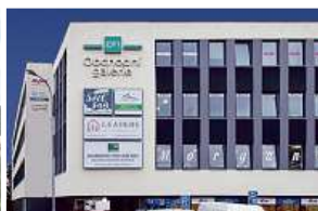
Obchodní galerie, Jihlava