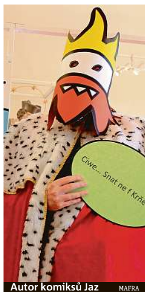
Autor komiksů Jaz