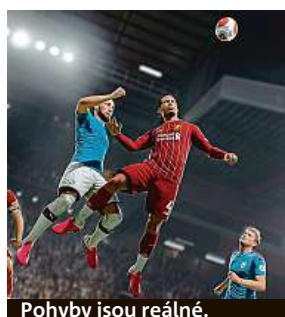
Pohyby jsou reálné.

Na parádní fyzikální model a realistický pohyb hráčů po hřišti jsou určité již všichni znalí hráči série FIFA zvyklí,