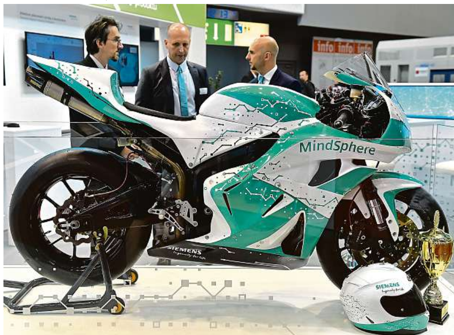
Rídicí jednotka je propojena s cloudovou platformou pro internet věcí MindSphere.

„Zpracováváme deset procent obrátu českého gastru, takže přes naše zařízení protече každý den obrovské množství citlivých dat. Kdyby-