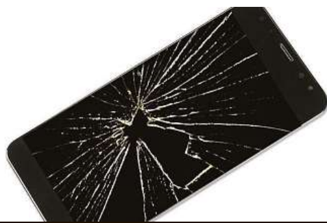
Ochranné sklo FIXED

Budeme-li hledat jednu část mobilů, která vyžaduje největší ochranu, statistiky oprav hovoří jasně. Jsou to displeje.