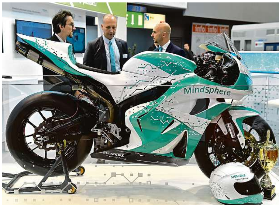
Rídící jednotka je propojena s cloudovou platformou pro internet věcí MindSphere.

„Zpracováváme deset procent obrátu českého gastru, takže přes naše zařízení protече každý den obrovské množství citlivých dat. Kdyby-