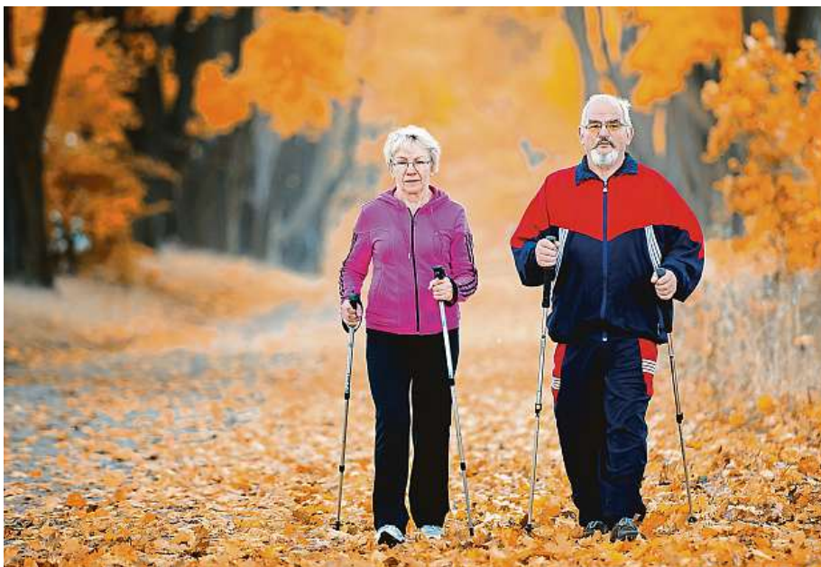
Pro lidi s revmatoidní artritidou je vhodná chůze.

„Cílem akce je motivovat pacienty s revmatickým onemocněním k pravidelnému pohybu a současně zvýšit je-