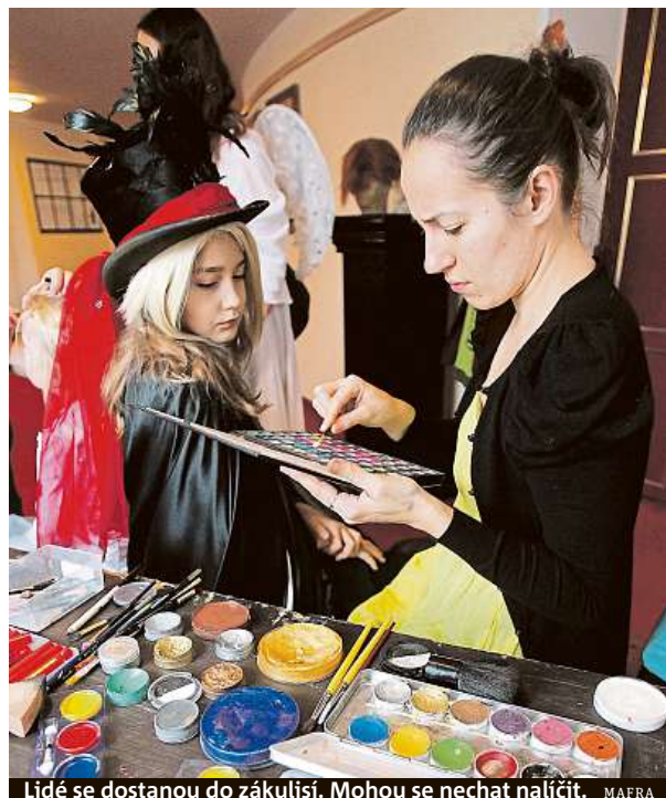
Lidé se dostanou do zákulisí. Mohou se nechat nalíčit. MAFRA

Do pražské části akce se zapojí významné scény, ale také ty méně známé – alternativní. Program se v těchto dnech chystá. Více informací najdete na webu festivalu Nocdivadel.cz . MET