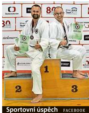
Sportovní úspěch FACEBOOK

Práci strážníků oceňují i v Letňanech. Alespoň podle děkovaného dopisu, který napsal muž z Chlebovnické ulice. Minulý týden u něj totiž zazvonila hlídka s dotazem, zda je majitelem vozu před