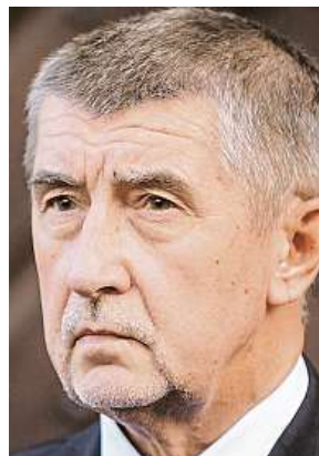
Vzájemní kritici – Miroslav Kalousek a Andrej Babiš