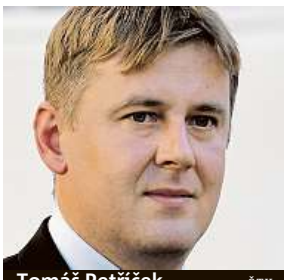
Tomáš Petříček