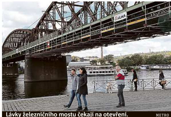
Lávky železničního mostu čekají na otevření.

Podle mluvčí TSK Barbory Liškové se tak stane v následujících dnech. Tedy zhruba o dva týdny později, než bylo v plánu. „Přesný termín nemáme k dispozici, ale bude to zhruba v polovině října. Zpomalilo nás rozhodování o podobě vnitřního zábradlí dle památkové ochrany mostu. Kvůli tomu šlo později do výroby,“ říká pro deník Metro Lišková.