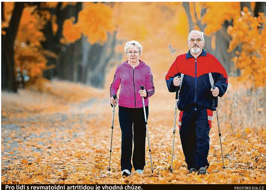
Pro lidi s revmatoidní artritidou je vhodná chůze.

„Cílem akce je motivovat pacienty s revmatickým onemocněním k pravidelnému pohybu a současně zvýšit je-