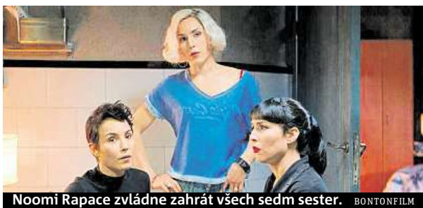
Noomi Rapace zvládne zahrát všech sedm sester.

V akčním sci-fi thrilleru 7 životů hrají v hlavních rolích Noomi Rapace a Willem Dafoe.