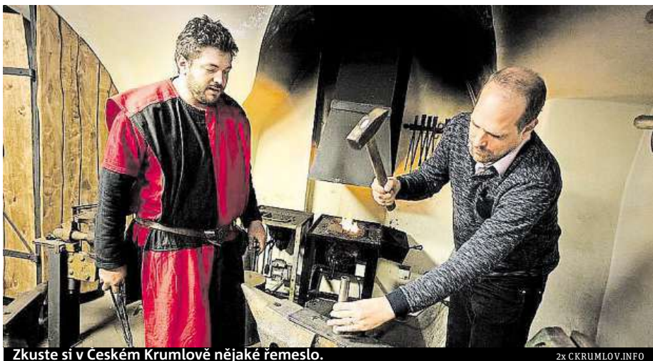
Zkuste si v Českém Krumlově nějaké řemeslo.