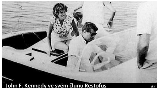
John F. Kennedy ve svém člunu Restofus

Dražené houpací křeslo bylo vyrobeno přímo pro Kennedyho kvůli jeho poranění zad a používal je v Bílém domě. Sluneční brýle nosil týden před osudovým atentátem v texaském Dallasu.