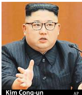
Kim Cong-un

Severokorejský vůdce Kim Jong-un posiluje svoji moc. Do nejvyššího vedení země dosadil sestru Kim Jo-čong. Podle agentury Reuters se tak stalo v sobotu, když ústřední výbor vládnoucí Korejské strany práce zvolil Kim Jo-čong kandidátkou svého všemocného politického byra.