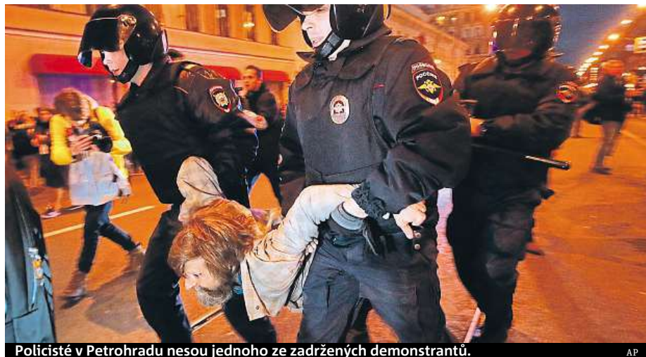
Policiisté v Petrohradu nesou jednoho ze zadržených demonstrantů.

Na podporu opozičního vůdce Alexeje Navalného demonstrovali Rusové v osmdesáti městech.