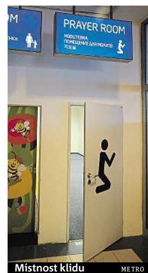
Místnost klidu METRO