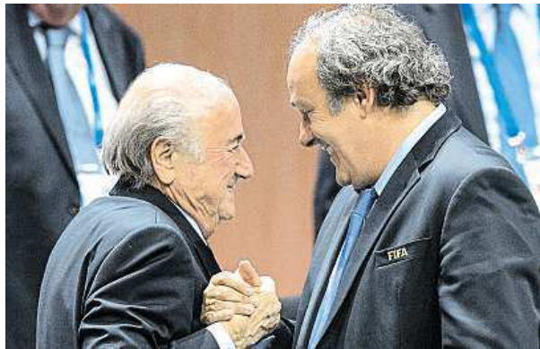
Sepp Blatter a Michel Platini důvody k úsměvu nemají.

Předsedům FIFA Seppu Blatterovi i UEFA Michelu Platiniemu byly pozastaveny na tři měsíce funkce.