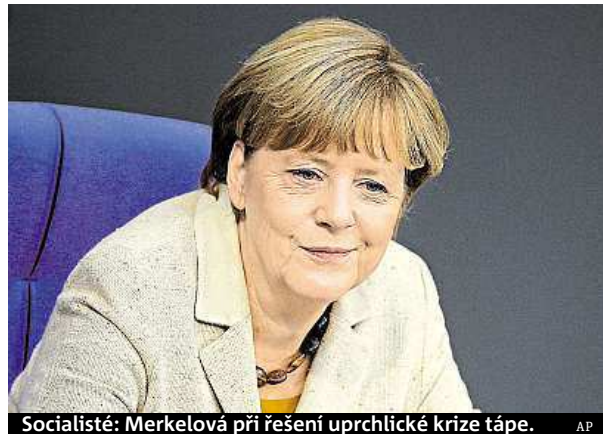
Socialisté: Merkelová při řešení uprchlické krize tápe.

Socialisté varují, že kancléřka nevládá uprchlickou krizi. Riskuje tím prý, že ztratí sympatie Němců.