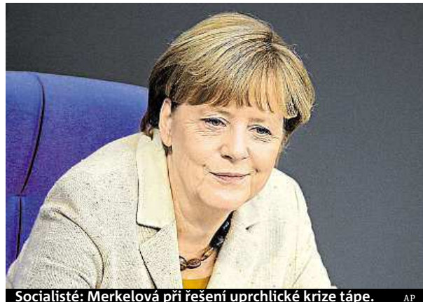
Socialisté: Merkelová při řešení uprchlické krize tápe.

Německá kancléřka Angela Merkelová nemá dlouhodobý plán, jak řešit uprchlickou krizi. Tvrdí to představitelé sociální demokracie (SPD), která spolu s konzervativní unií CDU/CSU tvoří vládní koalici. Socialisté se bojí, že příchod desítek tisíc běženců může být příliš nákladný a negativně ovlivnit fungování obcí. „Angela Merkelová se nesnaží předložit na stůl propracovanou společenskou koncepci, ale rozhoduje se krátkodobě,“ řekla včera generální tajemnice socialistů Yasmin Fahimiová. Ta varovala, že by se dosud převážně vstřícný postoj Němců k uprchlíkům mohl změnit, pokud se situace začne negativně projevovat na každodenním životě lidí. „Nesmí vznik-