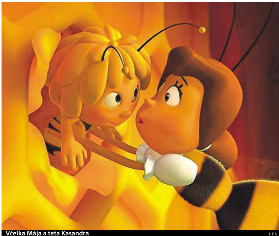
Včelka Mája a teta Kasandra

Premiéra filmu je naplánována na 6. listopadu. METRO