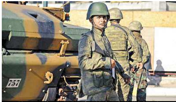
Turci jsou v pohotovosti, Kobani je hned u jejich hranic.

Boje pak pokračují především o strategické syrské město Kobani u hranice s Turec-