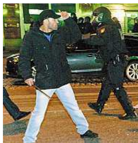
Nepokoje v Hamburku

kem. Kurdové město úpěnlivě brání, pomohlo jim však devět cílených leteckých náletů USA a jejich spojenců. Po nich byli bojovníci Islámského státu donuceni k částečnému ústupu z města. Jeden z místních aktivistů na sociální síti Facebook napsal, že některé ulice na jihovýchodě města „jsou plné mrtvých bojovníků DAIS“, což je arabská zkratka pro Islámský stát. čtr