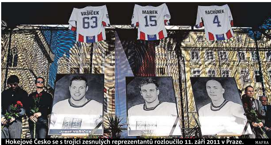
Hokejové Česko se s trojicí zesnulých reprezentantů rozloučilo 11. září 2011 v Praze.