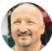
Třeba náš prezident Miloš Zeman.