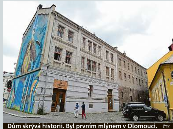
Dům skrývá historii. Byl prvním mlýnem v Olomouci.