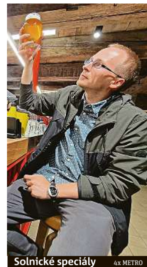
Solnické speciály 4x METRO