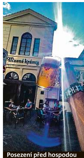
Posezení před hospodou