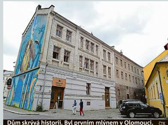
Dům skrývá historii. Byl prvním mlýnem v Olomouci.