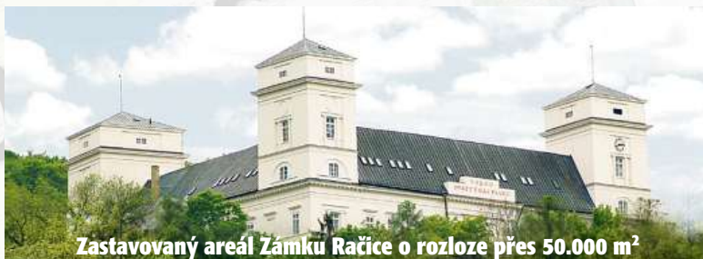
Zastavovaný areál Zámku Račice o rozloze přes 50.000 m 2