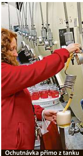
Ochutnávka přímo z tanku

Minipivovar Knežínek sídlí v okrajové části Nové Dvory se dokonce pyšní tím, že byl prvním malým pivovarem v Českých Budějovicích. Ten také určitě stojí za „pivní“ návštěvu. My jsme však zůstali ve městě, jemuž místní říkají Budějce a které vzniklo už v raném středověku. Sestavili jsme pro vás průvodce, jenž vám zdejší pivo představí od A do Z, ale vy prakticky neopustíte širší centrum města. V něm je plno různých ubytovacích kapacit a dalšího kulturního sportovního vyžití – neváhejte zabrousit na oficiální stránky města a bukovat! MET