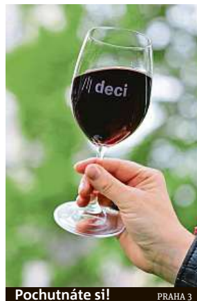
Pochutnáte si! PRAHA 3

Zítřejší se v benešovském pivovaru konají tradiční pivovarské slavnosti. Ferdinand představí celý svůj sortiment