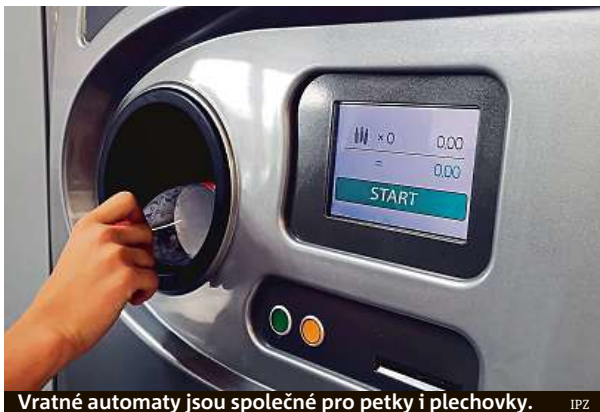
Vratné automaty jsou společné pro petky i plechovky. IPZ

Už víme, že za jeden kus by český spotřebitel mohl při výkupu dostat až pět korun, to ale záleží na konkrétní ekonomické rozvaze nápojářů. Také víme, že vracet by se měly obaly od 0,1 litru do tří litrů. Už je vytipováno jedenačtyřicet tisíc obchodů nad pade-