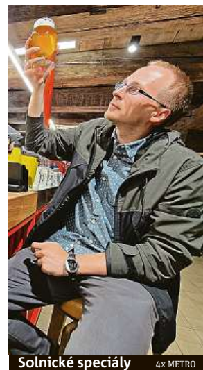
Solnické speciály 4x METRO