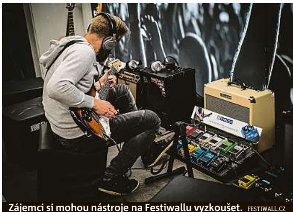
Zájemci si mohou nástroje na Festiwallu vyzkoušet.

Slavnosti vína se konají také v Praze 3. Na náměstí Jiřího z Poděbrad je připraveno Vinohradské vinobraní. Dnes a zítra bude pro návštěvníky připraven „česko-slovenský“ hudební i dětský program i ochutnávky vín a pochutin z obou zemí. „Pozvání přijal také několikanásobný sloven-