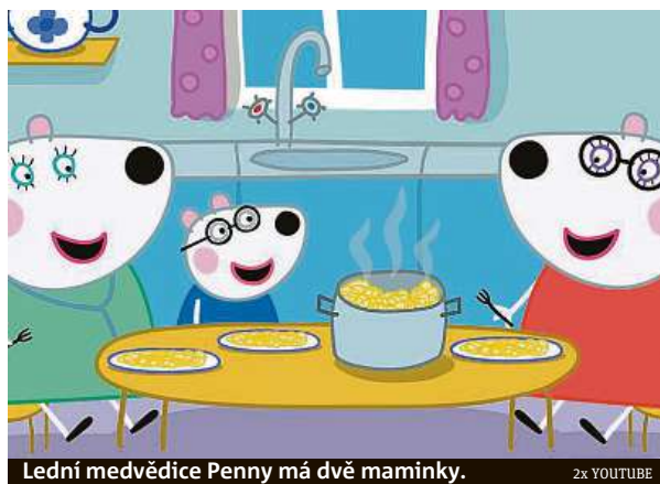
Lední medvědice Penny má dvě maminky.