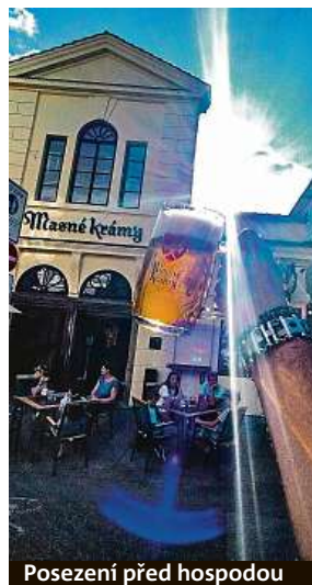
Posezení před hospodou