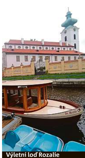
Výletní loď Rozálie