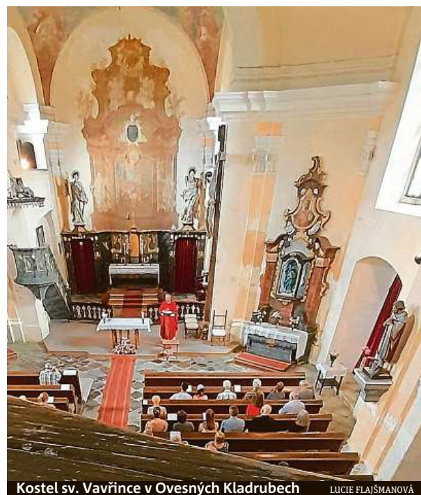
Kostel sv. Vavřince v Ovesných Kladrubech

Obec a Kanonie premonstrátů kláštera Teplá nyní vyhlásily veřejnou sbírku na opravu kostela. Vyzývají všechny, koho příběh zaujal, ať se zapojí jakoukoli finanční částkou. Jak poslat příspěvky do veřejné sbírky, se mohou lidé dozvědět na zdejší radnici, kontakty jsou na webu www.ovesnekladruby.cz . MET