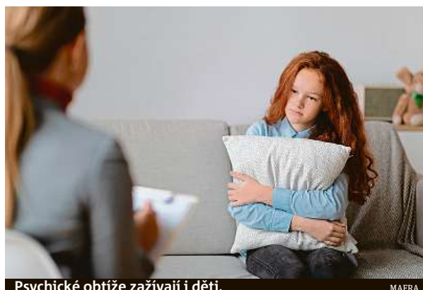
Psychické obtíže zažívají i děti. MAFRA

„V loňském roce zemřelo v Česku v důsledku sebevražedného jednání 966 mužů