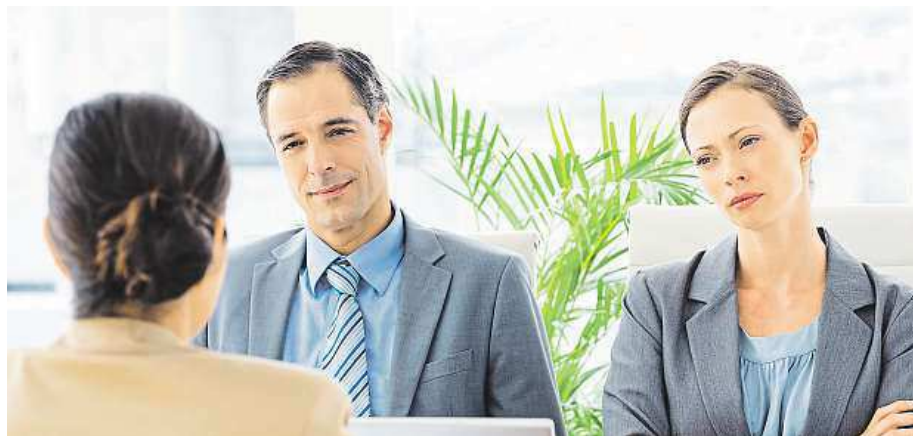
Pracovní pohovor bývá často stresující, ale nemusíte odpovídat na vše.