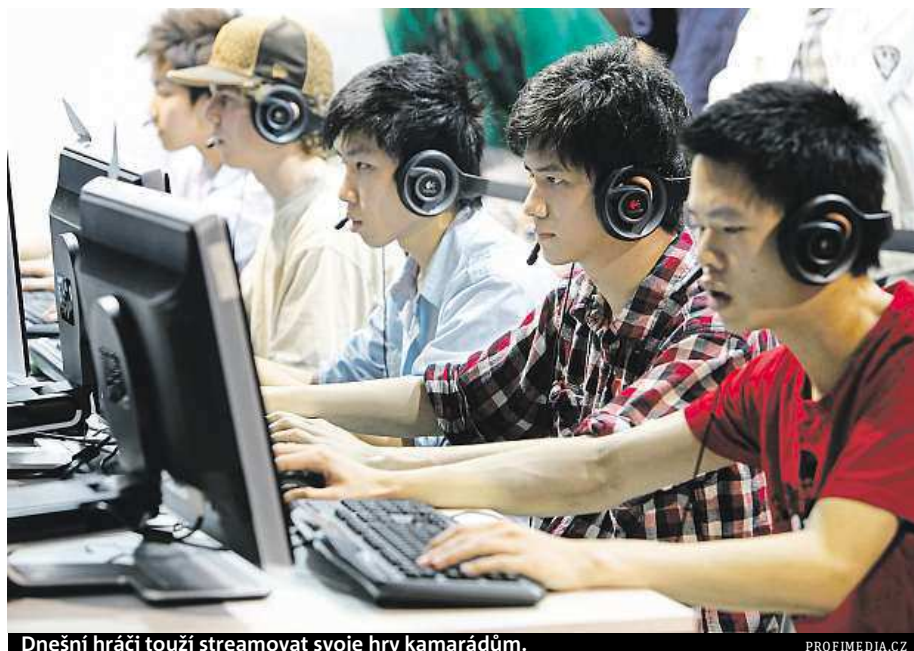
Dnešní hráči touží streamovat svoje hry kamarádům.

V Mironetu vsadili na nejvýkonnější procesor pro dané účely – Intel Core i7-4790 se čtyřmi jádry, taktovaný na základní frekvenci 3,6 GHz