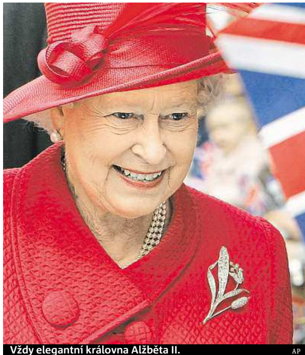
Vždy elegantní královna Alžběta II.

Její otec byl totiž až druhý v následnické linii. V prosinci 1936 však abdikoval jeho bratr Eduard VIII., aby se mohl oženit s rozvedenou Ameri-