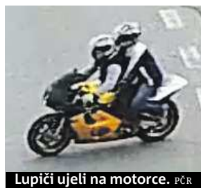
Lupiči ujeli na motorce. PCR

skohradištské policejní mluvčí Mileny Šabatové jsou pachatelé podezřelí ze zvlášť závažného trestného činu násilného charakteru. Kromě loupeže může jít i o pokus o vraždu. Policisté žádají o pomoc při pátrání širokou veřejnost. „Tyto osoby jsou ozbrojené, proto se je, prosím, nesnažte zadržet,“ řekla Šabatová. ČTK