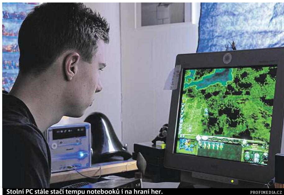
Stolní PC stále stačí tempu notebooků i na hraní her.

Spojení nejnovějšího čtyřjádrového procesoru Intel Core i5-6600K s jednou z nejvýkon-