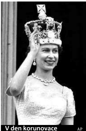
V den korunovace

Dnes Alžběta II. svou praprababičku překoná.