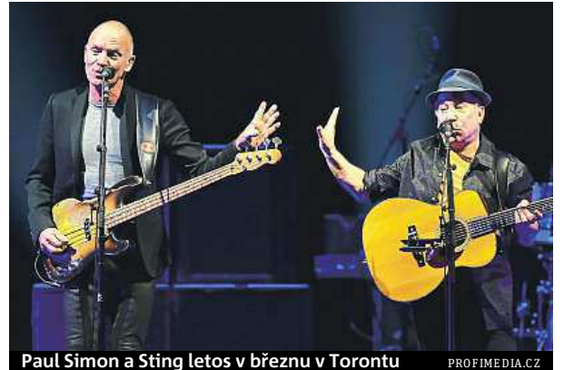
Paul Simon a Sting letos v březnu v Torontu

Stejně jako na severoamerickém turné počátkem letošního roku se oba věhlasní skladatelé a zpěváci představí v Praze s doprovodnými kapelami. Americká část turné se setkala s pozitivním ohlase. „Jeden z nejpřekvapivěj-