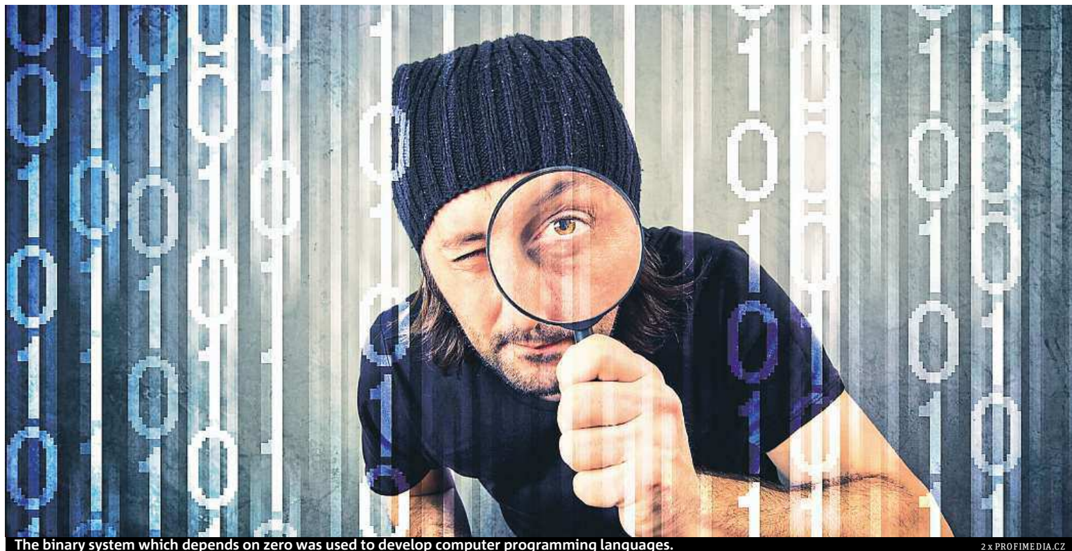
The binary system which depends on zero was used to develop computer programming languages.