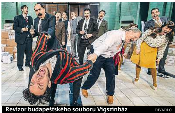
Revizor budapeštského souboru Vígszínház

Sting vystoupil v Česku již několikrát, naposledy v listopadu 2012 v Ostravě, třináctinásobný držitel Grammy Paul Simon v roce 1991 na letenském fotbalovém stadionu Sparty. ČTK