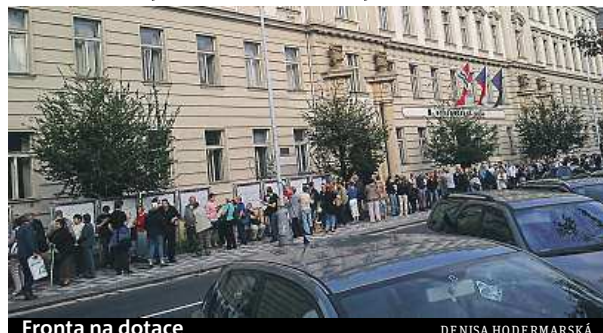
Fronta na dotace