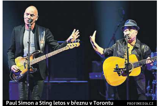
Paul Simon a Sting letos v březnu v Torontu

Stejně jako na severoamerickém turné počátkem letošního roku se oba věhlasní skladatelé a zpěváci představí v Praze s doprovodnými kapelami. Americká část turné se setkala s pozitivním ohlase. „Jeden z nejpřekvapivěj-