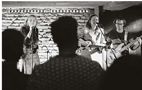
Trio pod názvem Jiný Metro koncertuje už pět let. Letos se chystá do Rumunska, v Česku pak plánuje ještě další koncerty v říjnu. P. ORLOVÁ

Už dnes si fanoušci mohou trio poslechnout na koncertě, který se uskuteční v šest hodin v pražských Holešovicích v Džungli BKAO. „Velmi se těšíme. Během našich vystoupení se na scéně vystřídá 12 hudebních nástrojů a vsadíme se, že návštěvníci uvidí alespoň jeden hudební nástroj, se kterým se dosud nesešli. Mohou se těšit na písničky, které v současnosti nahráváme, abychom je na podzim mohli vydat jako EP,“ pokračuje Katie, druhá ze zpěvaček. EP je označení hudební