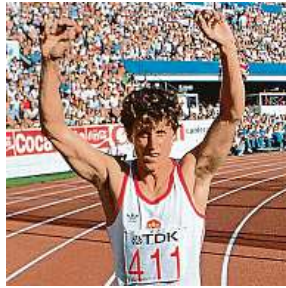
Jarmila Kratochvílová

Na prvním atletickém mistrovství světa v Helsinkách v roce 1983 zažila československá výprava nebývalou medailovou sklizeň. Se ziskem čtyř zlatých, tří stříbr-