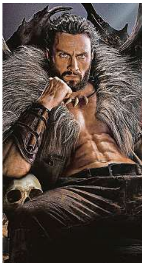
Lovce Kraven to letos v kinech balí. Dorazí později.

Doposud mlčí zástupci studia Warner Bros., jehož sci-fi thriller Meg 2: Příkop s Jasonem Stathamem v hlavní roli se své premiéry minulý týden dočkal. Navzdory stávce scenáristů a hlavně herců, kteří oficiálně nesměli snímek do datečně propagovat. Webové