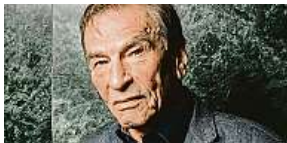
František Němec

Proslavil se coby tatínek a horelec ve filmových veselohrách nebo v dalších snímcích, mezi než patří třeba Všichni moji blízcí, Rebelové či Samotáři. Vynikající je v divadle i dabingu. František Němec, majitel obrovské škály hereckého mistrovství, dnes slaví 80. narozeniny. ČTK