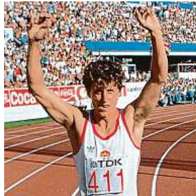
Jarmila Kratochvílová

Na prvním atletickém mistrovství světa v Helsinkách v roce 1983 zažila československá výprava nebývalou medailovou sklizeň. Se ziskem čtyř zlatých, tří stříbr-