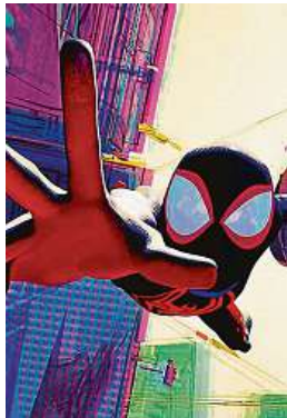
Třetí kreslený Spider-Man byl odsunut na neurčito.