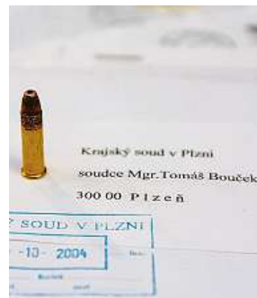
Vyděrač ze staré školy. Adresu napsal formálně správně.

Na psaní dopisů i v éře SMS a e-mailů pamatuje i ministerstvo školství. „V rámcovém vzdělávacím programu pro