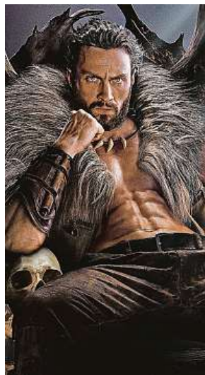
Lovce Kraven to letos v kinech balí. Dorazí později.

Doposud mlčí zástupci studia Warner Bros., jehož sci-fi thriller Meg 2: Příkop s Jasonem Stathamem v hlavní roli se své premiéry minulý týden dočkal. Navzdory stávce scenáristů a hlavně herců, kteří oficiálně nesměli snímek do datečně propagovat. Webové