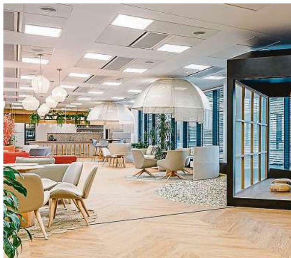
Kombinace většího prostoru s několika zvukově odstíněnými menšími kancelářemi, to je v současnosti už standard. LMC

O tolik procent se zmenšila v uvedených kancelářích podlahová plocha v porovnání s rokem 2021.