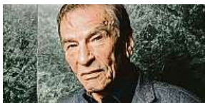
František Němec

Proslavil se coby tatínek a horelec ve filmových veselohrách nebo v dalších snímcích, mezi než patří třeba Všichni moji blízcí, Rebelové či Samotáři. Vynikající je v divadle i dabingu. František Němec, majitel obrovské škály hereckého mistrovství, dnes slaví 80. narozeniny.