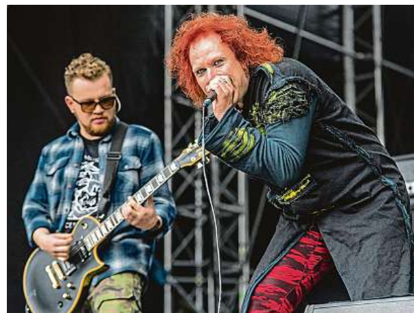
Finská hudební skupina Waltari byla založená roku 1986. Je známá kombinováním mnoha hudebních žánrů. MAFRA

mý Pražský výběr. „Vedle Plastic People je Pražský výběr kapelou, která na náš festival patří jak členka na náčelníkovu hlavu. Je s ním propojena pupeční šňůrou. Historicky i osudově, obě kapely byly totiž bolševikem zakázané stejně jako festival. Když se Pražský výběr objevil na českých pódii, bylo to zjevení. Podobně jako zjevení působil i náš Woodstock v době temna,“ řekl pro portál iDNES.cz zakladatel festivalu Martin Věchet. HOP