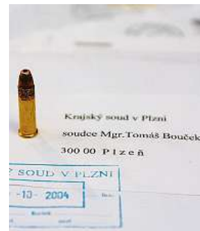
Vyděrač ze staré školy. Adresu napsal formálně správně.

Na psaní dopisů i v éře SMS a e-mailů pamatuje i ministerstvo školství. „V rámcovém vzdělávacím programu pro