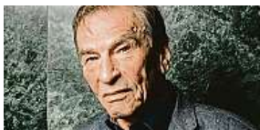
František Němec

Proslavil se coby tatínek a horolezec ve filmových veselohrách nebo v dalších snímcích, mezi než patří třeba Všichni moji blízcí, Rebelové či Samotáři. Vynikající je v divadle i dabingu. František Němec, majitel obrovské škály hereckého mistrovství, dnes slaví 80. narozeniny.