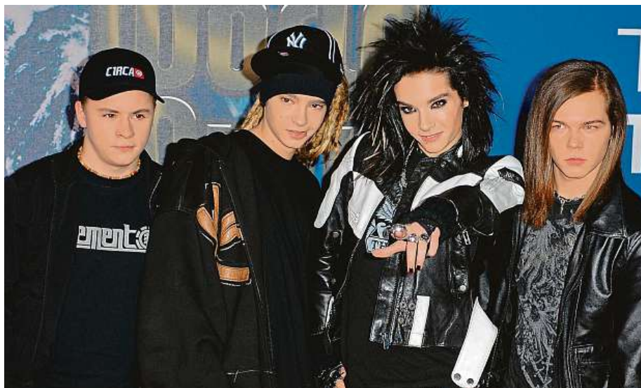
Pamatujete na emo hudební partičku Tokio Hotel? V roce 2006 bořila hitparády.