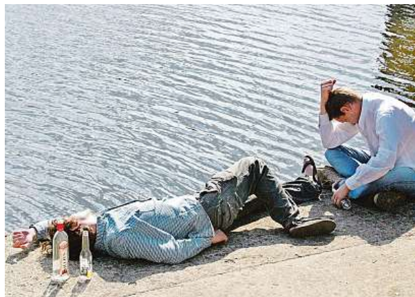
Popíjení v blízkosti vody není moc bezpečné.