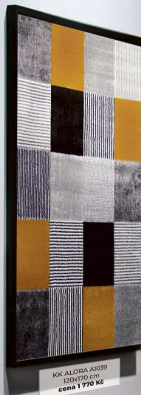
KK ALORA A1039 120x170 cm cena 1 770 Kč