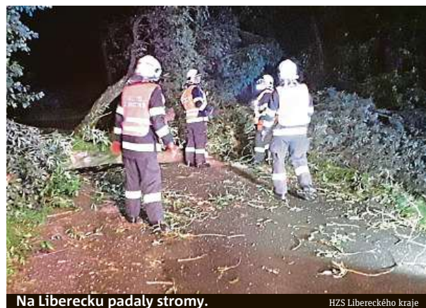
Na Liberecku padaly stromy.

Na příští dny předpovídají meteorologové spíše podmráčené, ale teplé počasí mezi 25 až 28 stupni Celsia. Leckde lze očekávat sluníčko, ale také letní deště. IDNES.cz