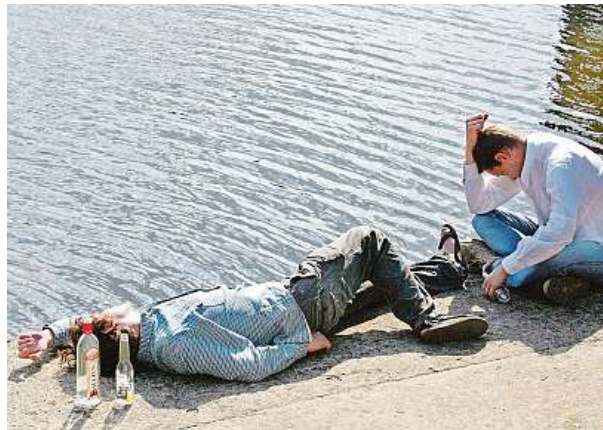
Popíjení v blízkosti vody není moc bezpečné.