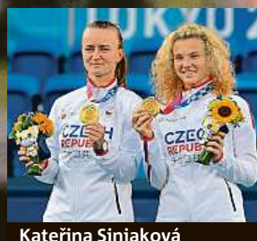
Kateřina Siniaková a Barbora Krejčíková