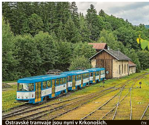
Ostravské tramvaje jsou nyní v Krkonoších. ČTK

Spolek plánuje i rekonstrukci výtopy na nádraží v Rokytnici, v níž je z prostorových důvodů jen jedna ze získaných tramvají. Zbylé tři stojí zatím venku. V Ostravě tak stály venku. „Tím, že rozjíždíme projekt, připravujeme kryté stání také pro ně,“ slibuje Jakubů. ČTK