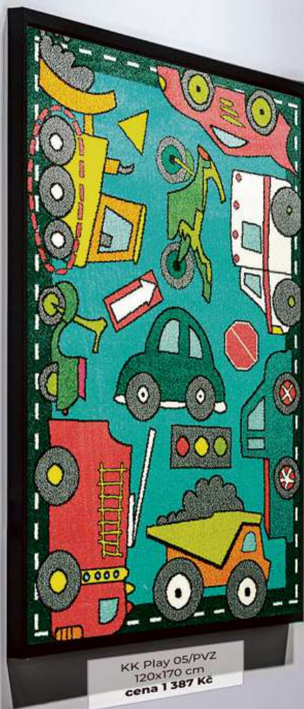
KK Play 05/PVZ 120x170 cm cena 1 387 Kč