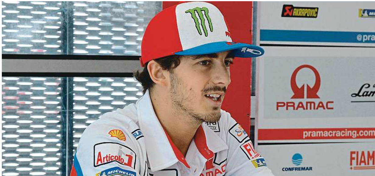
Loňský mistr světa Moto2 Francesco Bagnaia z Itálie zatím letos není v příliš oslnivé formě.

Rychlost. Když se podívám, jak jsem jezdil v roce 2013, kdy jsem v akademii ještě nebyl, a jak jsem se pak postupně propracoval až k titulu mistra světa v Moto2, je to obrovský rozdíl. Vždyť v roce 2013 jsem v šampionátu nezískal ani bod. Ano, není nic neobvyklého, že se člověk s přibývajícím věkem a zkušenostmi zlepšuje, ale nemyslím si, že by můj progres byl tak výrazný, kdybych nebyl členem VR46 Academy. Ve všech ohledech máme to nejlepší z nejlepšího. Trénovat s Valentinem na jeho ranči, zajezdit si jen tak na italských okruzích, to jsou drobnosti, které dělají rozdíl.