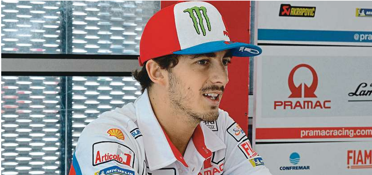
Loňský mistr světa Moto2 Francesco Bagnaia z Itálie zatím letos není v příliš oslnivé formě.

Rychlost. Když se podívám, jak jsem jezdil v roce 2013, kdy jsem v akademii ještě nebyl, a jak jsem se pak postupně propracoval až k titulu mistra světa v Moto2, je to obrovský rozdíl. Vždyť v roce 2013 jsem v šampionátu nezískal ani bod. Ano, není nic neobvyklého, že se člověk s přibývajícím věkem a zkušenostmi zlepšuje, ale nemyslím si, že by můj progres byl tak výrazný, kdybych nebyl členem VR46 Academy. Ve všech ohledech máme to nejlepší z nejlepšího. Trénovat s Valentinem na jeho ranči, zajezdit si jen tak na italských okruzích, to jsou drobnosti, které dělají rozdíl.