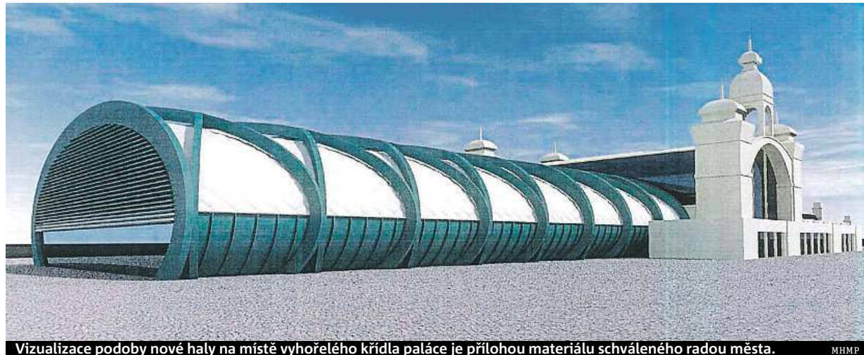
Vizualizace podoby nové haly na místě vyhořelého křídla paláce je přílohou materiálu schváleného radou města.