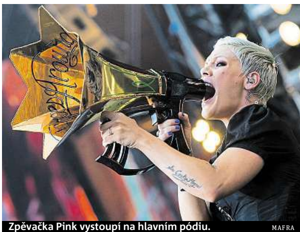
Zpěvačka Pink vystoupí na hlavním pódiu.

Ačkoliv nedlouho před začátkem zrušila svou účast kapela Clean Bandit a zpěvačka Rita Ora, program festivalu, který letos slaví 25. narozeniny, to příliš nenarušilo. Na několika pódiích vystoupí až do příští středy kapely a interpreti různých žánrů. Mezi lá-