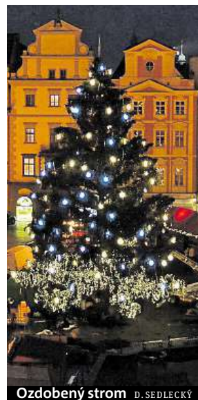
Ozdobený strom D. SEDLECKÝ

Loňský pocházel z Královéhradeckého kraje. Vyrostl na soukromém pozemku nedaleko městyse Pecka a byl starý