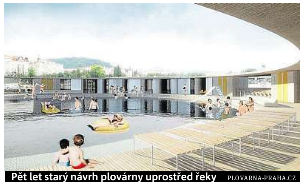
Pět let starý návrh plovárny uprostřed řeky PLOVARNAPRAHA.CZ

Už před pěti lety se objevil plán tří architektů na kruhovou plovárnu o průměru 50 metrů, s bazénem dlouhým 25 metrů, s přístupem po pontonové lávce nebo lodičkou. Koupalo by se v říční vodě filtrované speciální membránou. V zimě by pak bazén mohl sloužit jako kluzišť. ROW