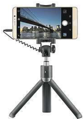
Selfie tyč Huawei AF14

Selfička jsou zkrátka běžnou součástí našeho života a právě selfie tyče sílu tohoto fenoménu ještě znásobily. A jak by také ne – focení je