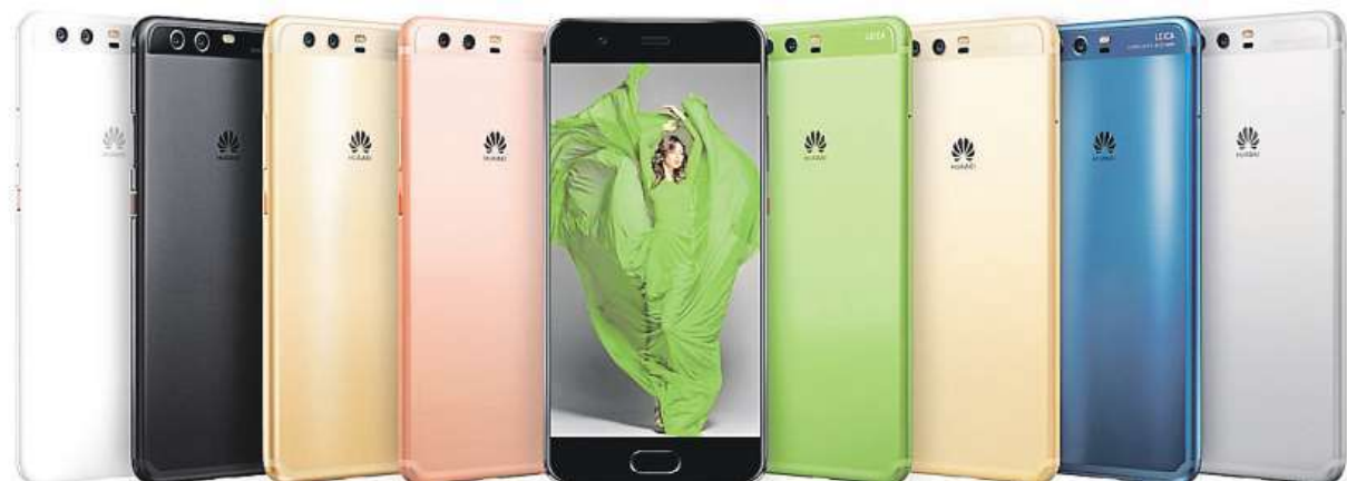
Huawei P10 si můžete pořídit za dobrou cenu a navíc v různých barevných provedeních.

Chcete špičkový mobil za lákavou cenu? Využijte jedinečné nabídky.