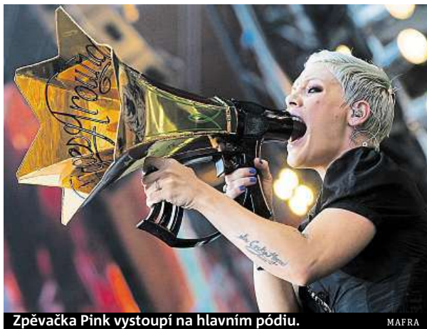
Zpěvačka Pink vystoupí na hlavním pódiu.

Ačkoliv nedlouho před začátkem zrušila svou účast kapela Clean Bandit a zpěvačka Rita Ora, program festivalu, který letos slaví 25. narozeniny, to příliš nenařušilo. Na několika pódiích vystoupí až do příští středy kapely a interpreti různých žánrů. Mezi lá-