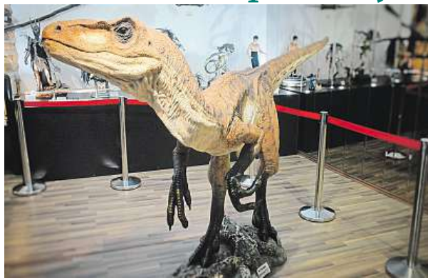
Dinosaurus Velociraptor z Jurského parku potěší i děti. MFL

Muzeum filmových legend v Poděbradech láká na nové atraktivní exponáty.