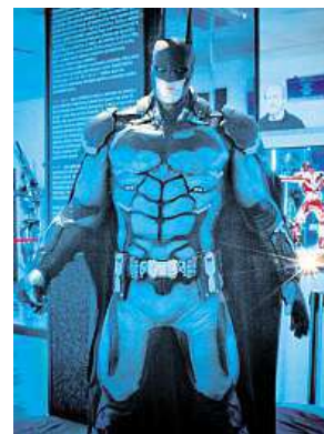
Socha Batmana MFL

Rozsáhlá sbírka se stále rozšiřuje. Nyní čítá přes 550 exponátů. Mezi novinky přidané v posledních týdnech patří impozantní sochy v životní velikosti – vesmírný lovec Predátor, komiksový hrdina Batman a dinosaurus Velociraptor z Jurského parku. Oblíbě se těší i nové vikendové komentované prohlídky s průvodcem. MET