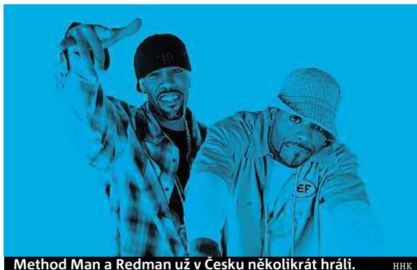
Method Man a Redman už v Česku několikrát hráli. HHK

Letos slaví Hip Hop Kemp už patnácté narozeniny a lineup je na 18. až 20. srpna opravdu nabitý. Mezi hvězdními gratulanti z USA patří legendární členové Wu-Tang Clanu Method Man &