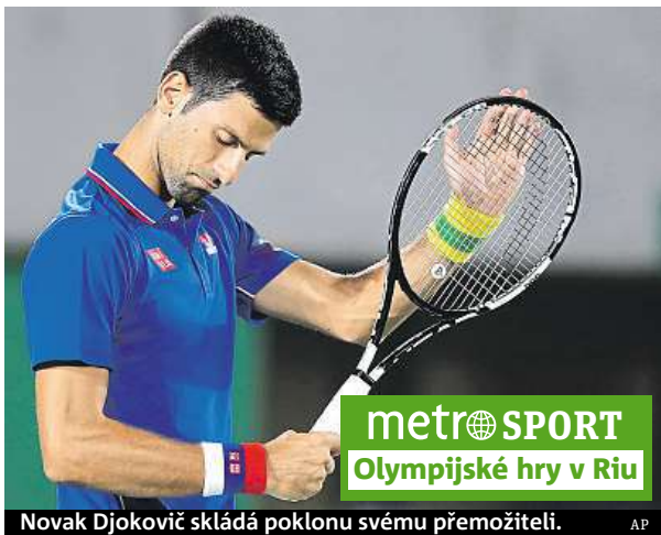
Novak Djoković skládá poklonu svému přemožiteli.

Šafářová výborně returnovala, Strýcová řádila na síti a nasazené jedničky vyřadily po skvělém výkonu za hodinu a 33 minut. „Sedlo nám všechno a v důležitých momentech Lucka vytáhla skvělé returny, takže jsem mohla na síť jít. Je to nádherné,“ zářila Strýcová. „Určitě si vítězství nad Serenou a Venus hodně ceníme, ale musíme zůstat při zemi. Čekají nás další těžké zápasy. Jede se dál,“ rek-