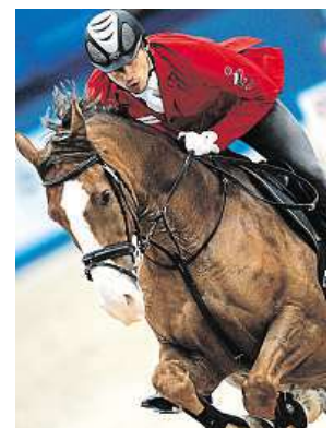
One of the events

I think you need to practise your Lithuanian.