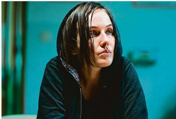
Film tematicky navazuje na Úsměvy smutných mužů. Tehdy šlo o problém hlavně mužů, během pandemie se však počty srovnaly.

Poslední sklenička, dnes už popáté. Každý se někdy napije, ne? Film Zápisník alkoholičky režiséra Dana Svátka se bude od čtvrtka v kinech zabývat tématem pití a závislosti na alkoholu.