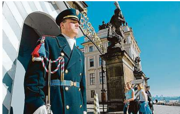
Do současné podoby první hradní nádvoří upravil architekt Jože Plečnik po roce 1920.

Změna se poprvé odehrála včera. Když se ve 12 hodin rozezněly na třetím nádvoří bubny Hudby Hradní stráže, jen pár turistů tušilo, oč se jedná. Kapelu obklopil hlouček lidí a začal si hudebníky nahřávat, někteří turisté začali i tancovat. Jiní návštěvníci