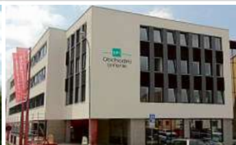
Obchodní galerie, Jihlava