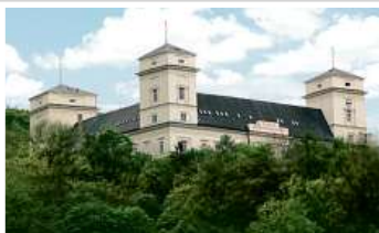
Zámek Račice, přestavba