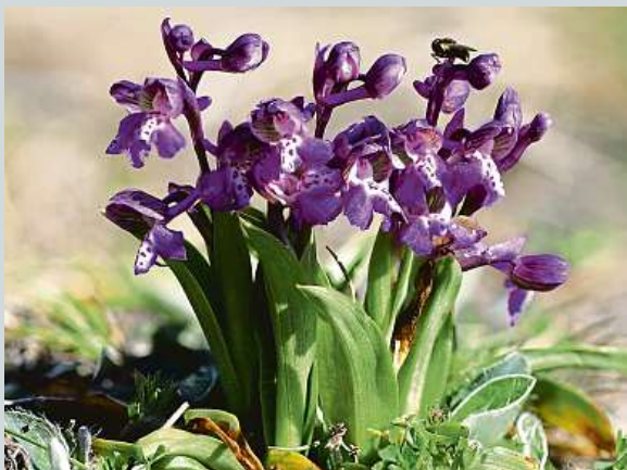
Zákonem chráněná orchidej vstavač kukačka ČSOP