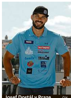
Josef Dostál v Praze.

Kajakář Josef Dostál je jednou z největších českých olympijských nadějí a trojnásobný bronzový medailista z her pod pěti kruhy má nejvyšší ambice. V singlkajaku chce útočit na zlato a rád by se prosadil i s Radkem Šloufem v deblkajaku. Před cestou na přípravný kemp Češi řeší problém s loděmi, které mají při cestě do Japonska zpoždění.