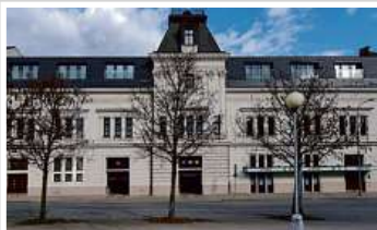
Multifunkční budova, Brno

Koncern e-Finance, a.s. v současnosti spravuje investice do nemovitostí v hodnotě přesahující 1 miliardu korun. Investiční strategií e-Finance je investovat prostředky získané z dluhopisů do nákupu a výstavby rezidenčních a komerčních nemovitostí v atraktivních lokalitách České republiky. Portfolio investic najdete na www.e-finance.eu .